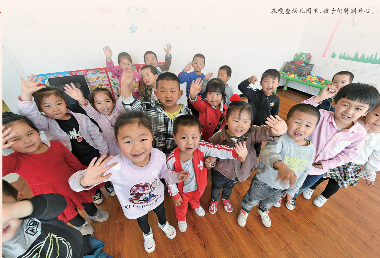
在嘎查幼儿园里,孩子们特别开心。