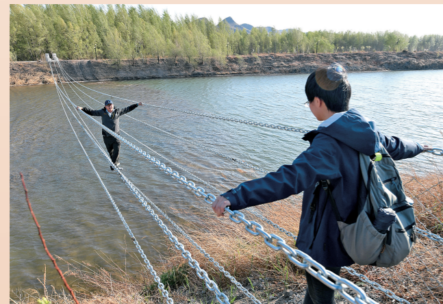
特色乡村旅游吸引不少游客。