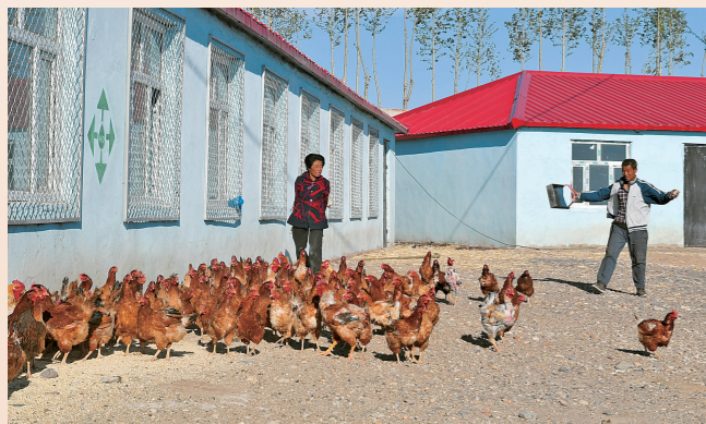
养鸡合作社带动农牧民增收。