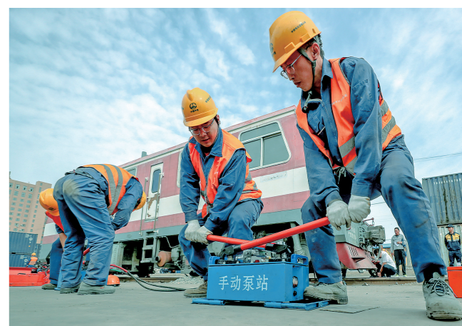
利用手动泵站进行液压起复。