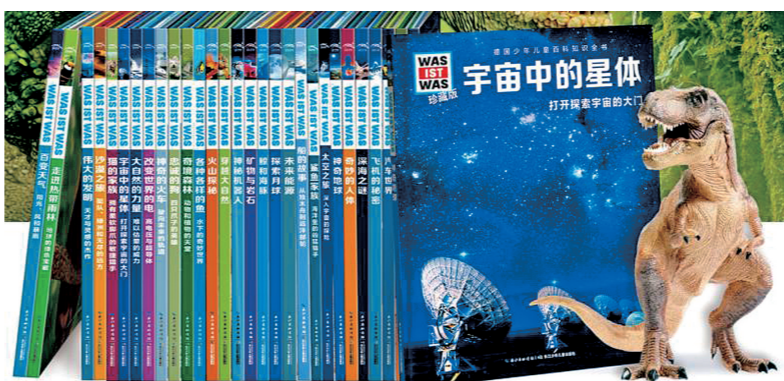
作者:(德)曼弗雷德·鲍尔等 出版社:长江少年儿童出版社

衰,已被翻译为39种语言,遍及45个国家和地区,深受世界各地青少年喜爱。而在德国本土,每个德国家庭至少有一本《是什么·为什么·怎么样》系列的图书,德国人从小就接受良好的科学知识的普及和科学精神的教育。