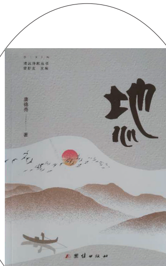
作者:唐德亮 出版社:团结出版社

冯唐认为最应该参悟的3句曾国藩的话:“大处着眼,小处着手”“屡败屡战”“扎硬寨,打呆仗”。在冯唐看来,普通人在成事的道路上遇到的绝大多数的问题,都源于没有参悟到这3句话所包含的道理。“为人处事,要能既见森林,又见树木,在做事的过程中,我们理所当然地会遭遇各种失败,但是如果不想一辈子都失败,就要持续做事,不怕输,千万不能够为了贪图一时的轻松和暴利去走捷径,捷径永远都是通往邪路最快的路。”