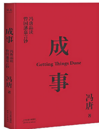
作者:冯唐 出版社:天津人民出版社