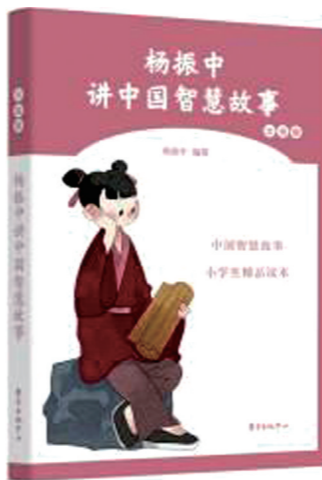
编者:杨振中 出版社:东方出版中心

做一个有情有义的人。书中既蕴涵了做人的操守,也有处世的法则。《包惊儿笃于友谊》讲述了清朝包惊儿宁可让自己的女儿等一上