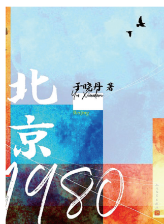
作者:于晓丹 出版社:人民文学出版社