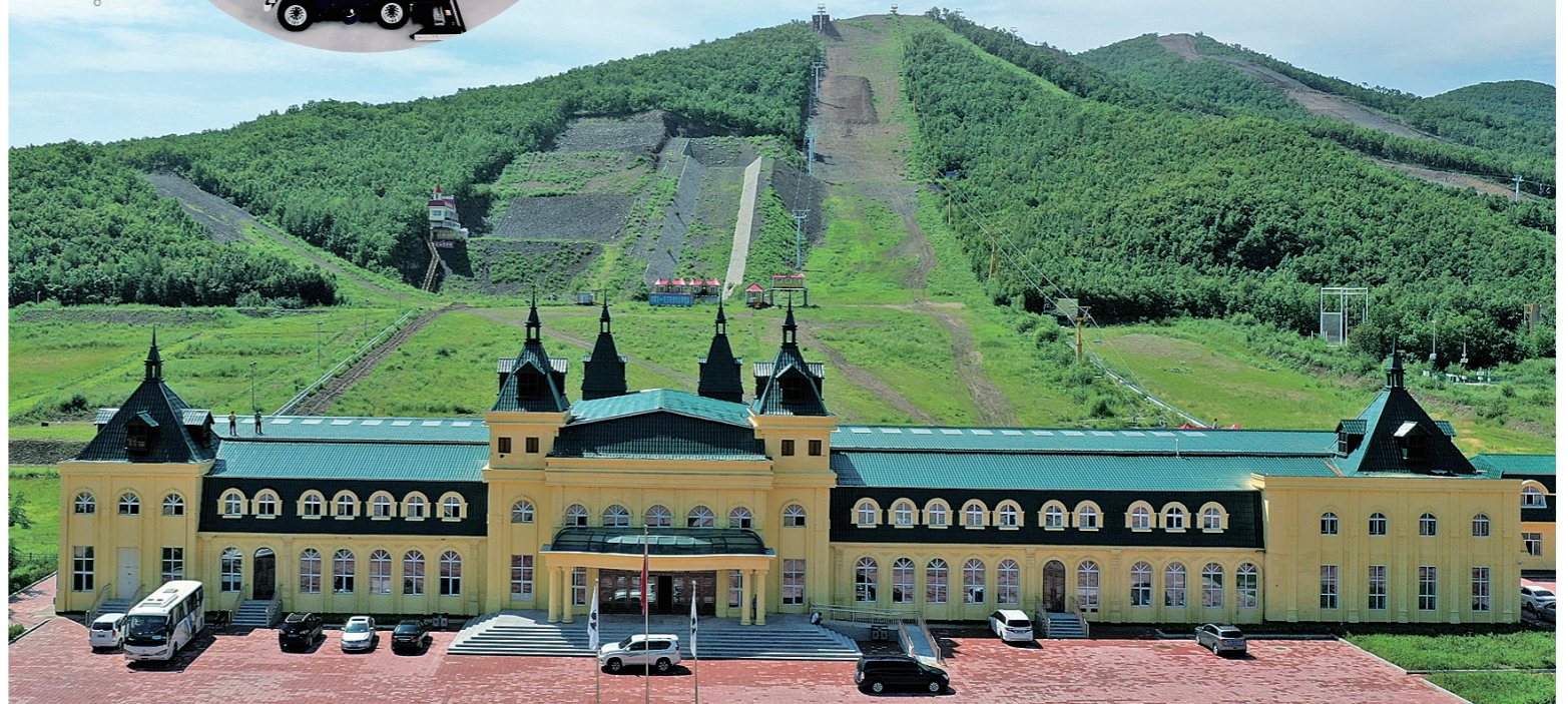
扎兰屯金龙山滑雪场。