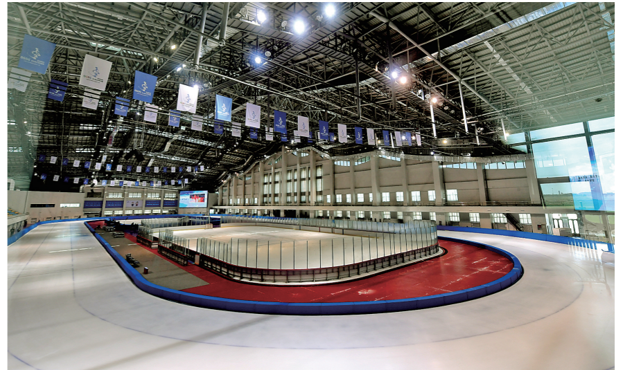
回转半径填补了区内承办国际A级赛事的空白。

“十四冬”离我们越来越近了，让我们相约2020年的2月，相约呼伦贝尔，体验一次难忘的冰雪之旅。