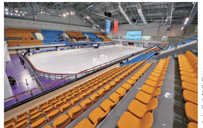
大道速滑馆观众席。