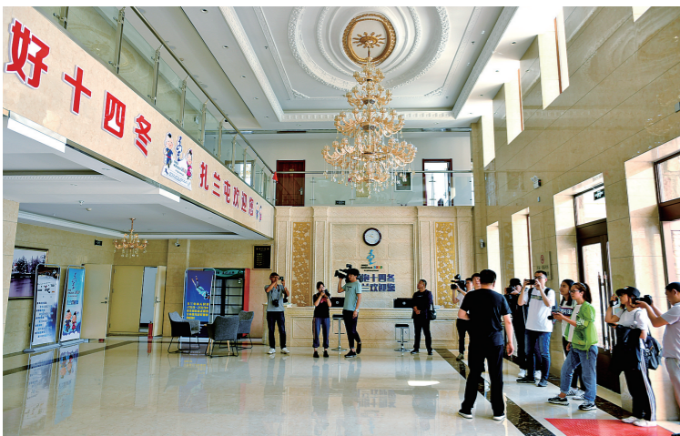
凤凰山滑雪场运动员公寓。