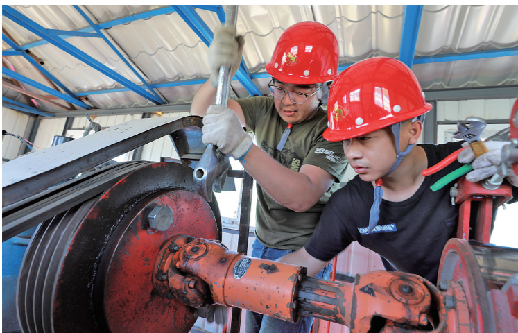
工作人员检修索道车。