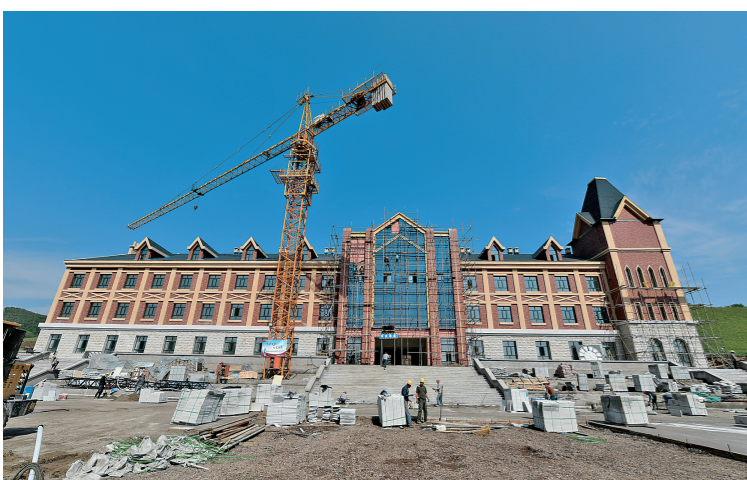
建设中的牙克石凤凰山滑雪场媒体新闻中心。