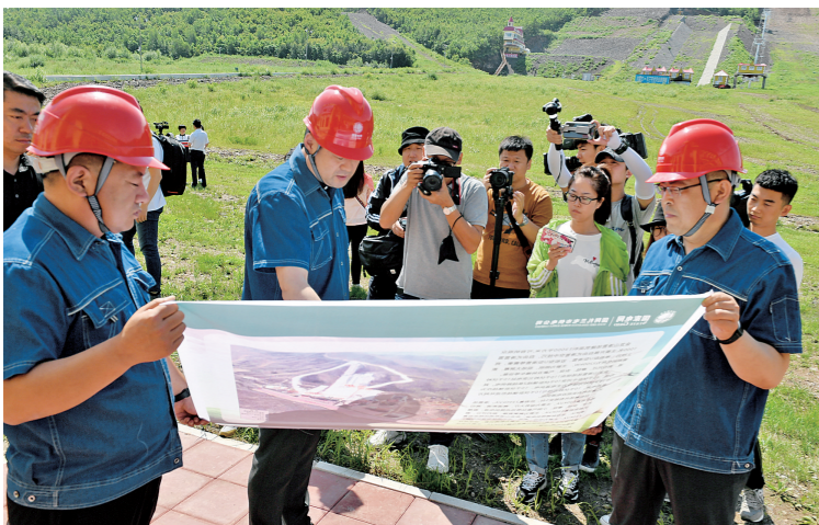
为记者介绍电力保障系统。