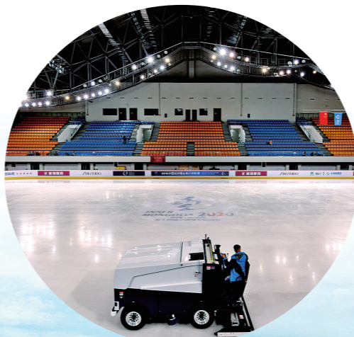
工作人员清理冰面。