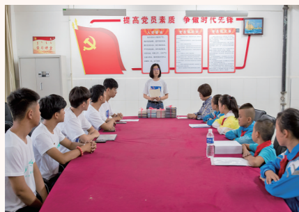
清华大学志愿者在开展支教工作前进行工作部署。