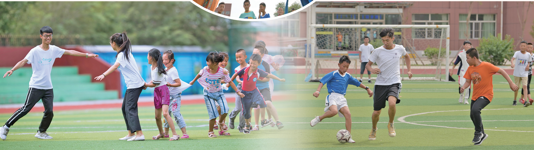
与学生们玩“老鹰捉小鸡”。