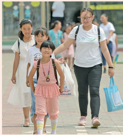
放学了,将学生们送到家长手中。