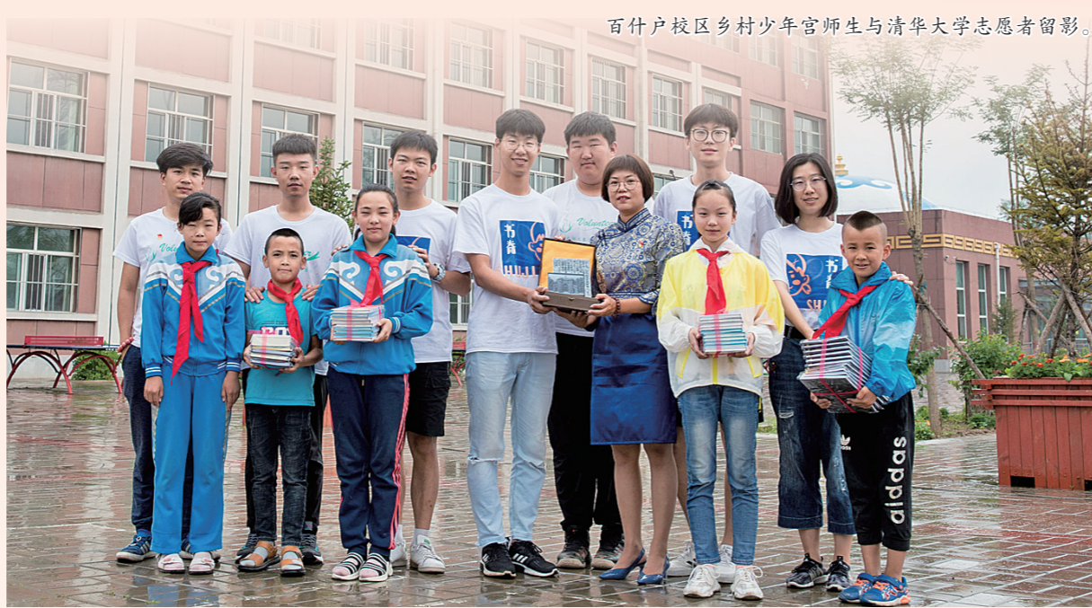
百什户校区乡村少年宫师生与清华大学志愿者合影。