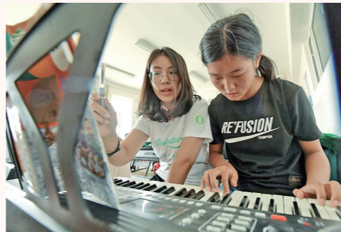
佳指导学生学习电子琴。