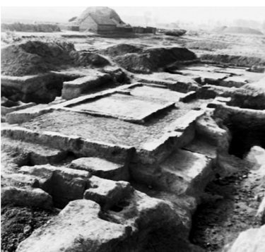
平粮台高台建筑基址。

为了管理城市的环境卫生,宋朝设置了专门的机构——街道司。街道司下有专职的环卫工人,其职责包括清扫街道、疏导积水、整顿市容。像开封、临安这样的大城市,每天早上都会有几百个环卫工人打扫街道,处理垃圾。除此之外,据《梦粱录》的记述,城市居民每日产生的生活垃圾、粪溺也