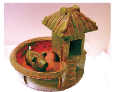
作为陪葬品的“圊”模型,上方为厕所,下方为猪圈。