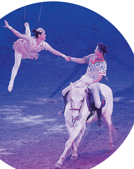
我和恋人敖包相会