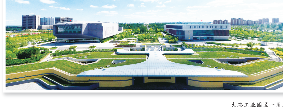
大路工业园区一角。