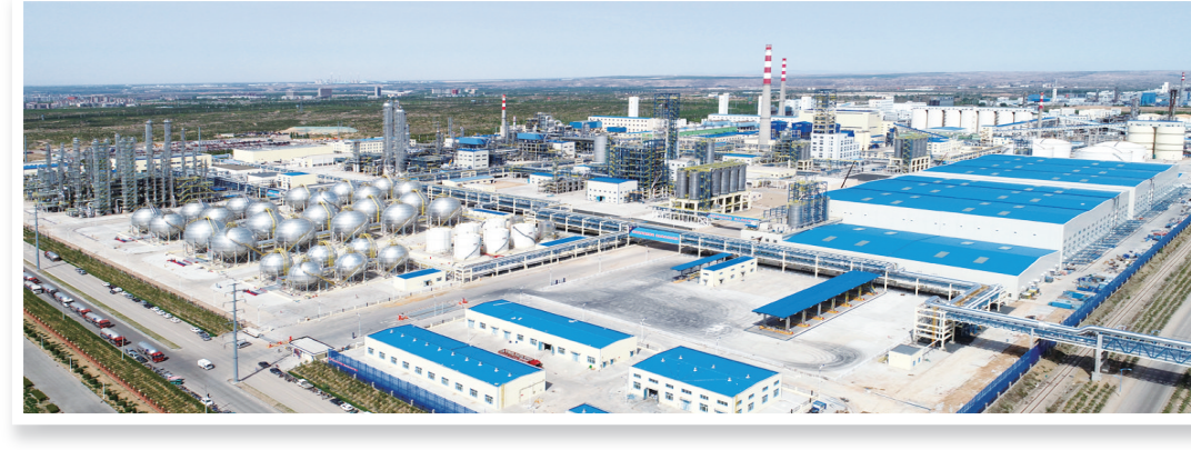
久泰能源内蒙古有限公司。