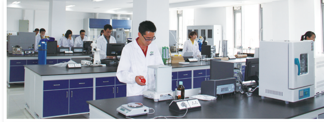
中科合成油实验室。

园区在产业升级的同时,也非常重视产业智能化改造及智慧园区建设工作,大路智慧园区建设方案已通过专家评审。园区将推动企业进行工业化、智能化和信息化的建设工作,主动利用工业4.0技术,推动互联网制造、智能工厂、工业机器人、3D打印等新技术的推广和应用。