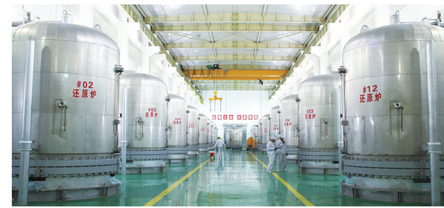
国电阳公司还原大厅。

盛夏时节,地处黄河“几”内湾的鄂尔多斯大路工业园区传来捷报:继久泰年产100万吨甲醇项目、年产60万吨烯烃项目之后,又一国家“十三五”煤炭深加工升级示范项目——中国石化鄂尔多斯大路煤制烯烃项目开工,自治区党委副书记、自治区主席布小林出席开工动员大会并宣布开工。 与时代同频共振,以奋斗书写华章!今年,大路工业园区在“形”与“势”的变化中坚定信心,在“危”与“机”的转换中把握机遇,在“稳”与“进”的统一中积极作为,园区经过调结构、促升级等一系列“神来之笔”,一个生态优先、绿色发展的靓丽园区正在祖国北疆熠熠生辉!今年1-6月,大路工业园区实现工业总产值199.45亿元。