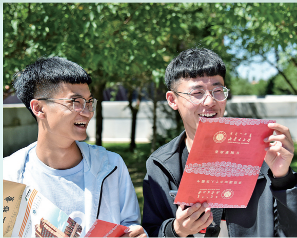
萌新入学门票 录取通知书