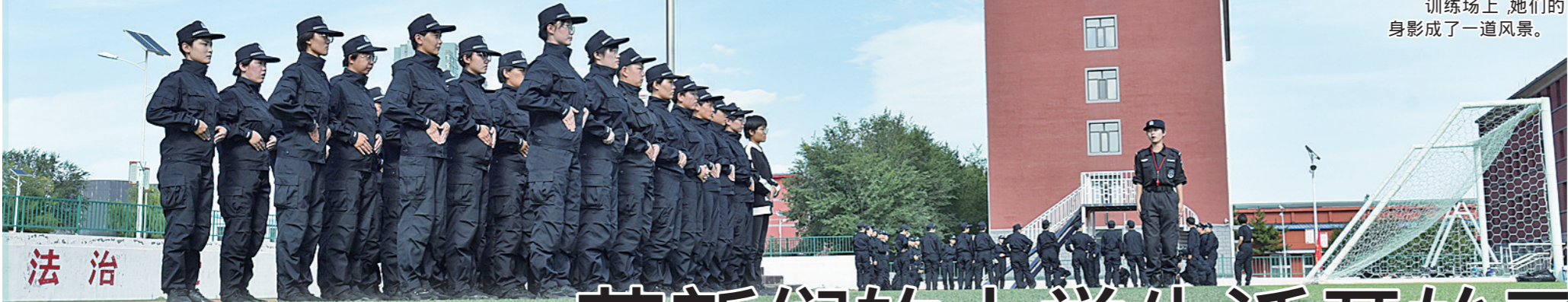
训练场上,她们的身影成了一道风景。

随着秋季开学季的到来,第二批00后登上高校舞台,成为新生主力军,奏响大学华章。他们出生在21世纪,视野开阔、思维活跃,热烈如歌,不负青春,追求上进笃定而行,展现了新时代青年有理想、敢担当的精神面貌。高校生活有很多模式,在图书馆里埋头苦学,在运动场上挥洒汗水,在贫困山区支教助学,还有一些大学生走进军营,披上迷彩,戎装出发。