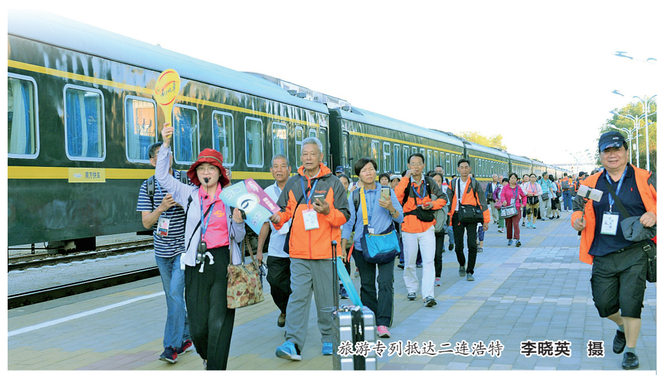
旅游专列抵达二连浩特