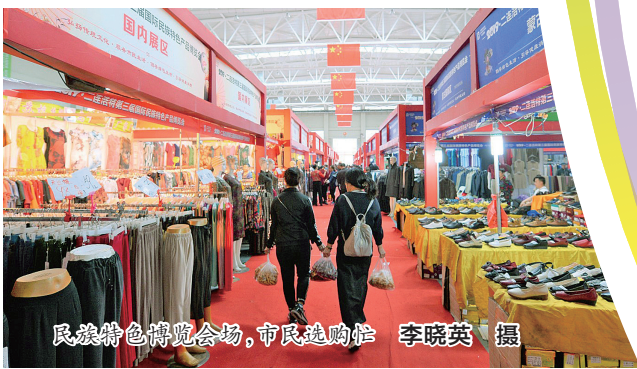
民族特色博览会场,市民选购忙