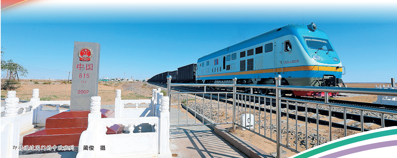
即将通过国门的中欧班列