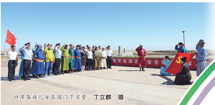
口岸各族儿女在国门下宣誓