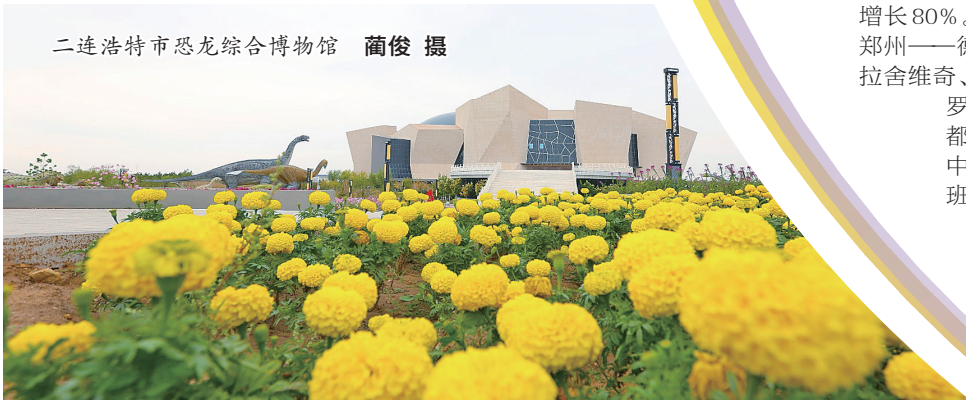
二连浩特市恐龙综合博物馆