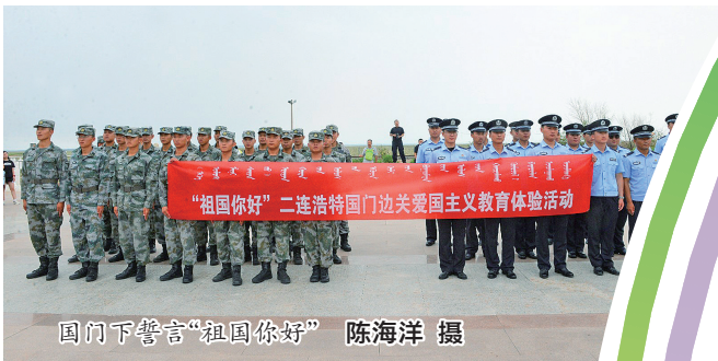
国门下誓言“祖国你好”