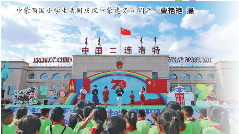
中蒙两国小学生共同庆祝中蒙建交70周年