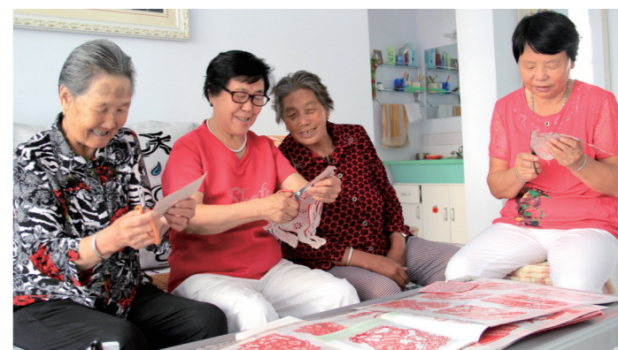
棚户区搬迁居民乐享晚年生活。