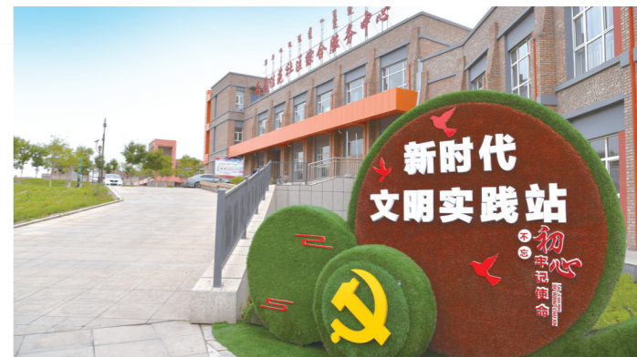
新时代文明实践站成为基层精神加油站。

截至目前,乌达区共建设各类棚改安置房25013套,总建筑面积约为206.4万平方米,总投资约90亿元,以多种形式搬迁安置煤矿棚户区居民19100余户,让有意愿搬迁的居民全部搬迁。