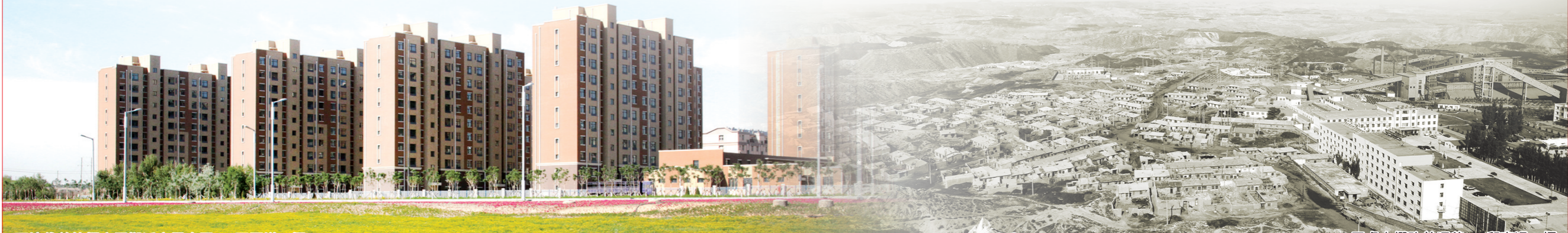
环境优美的棚户区搬迁安置小区。