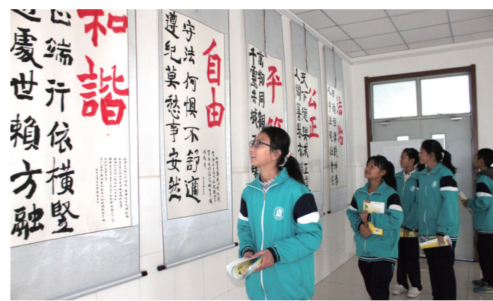
北师大附校学生接受社会主义核心价值观教育。