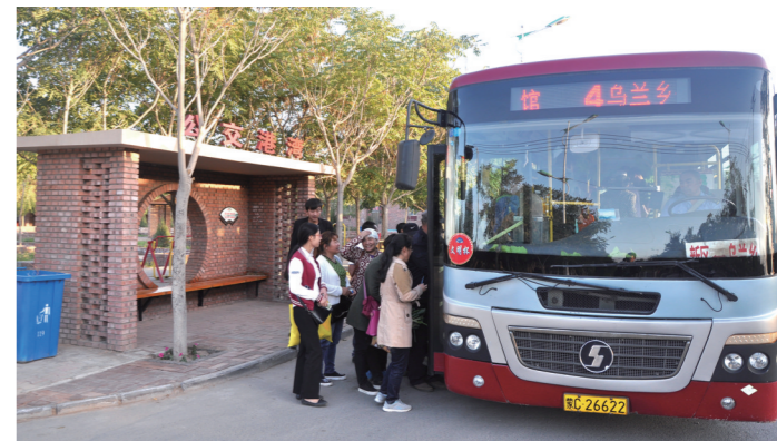
村里通了公交车。