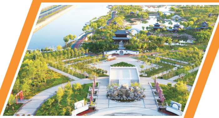
额济纳湿地文化公园。