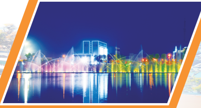
日新月异的城镇建设。