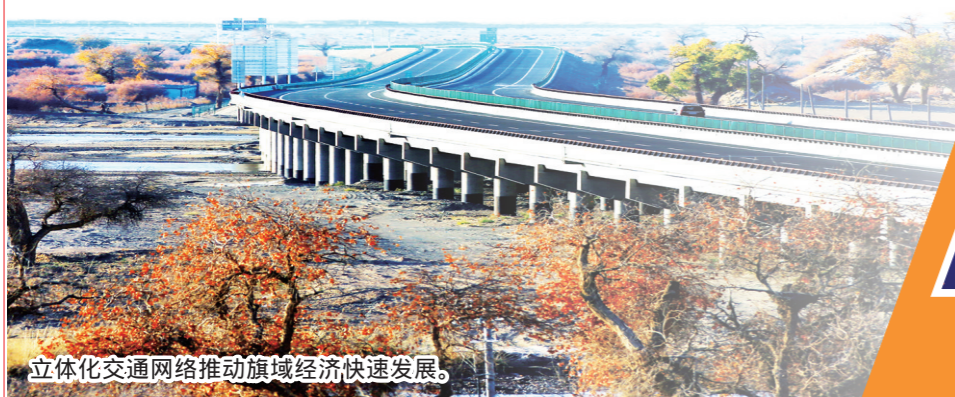
立体化交通网络推动旗域经济快速发展。