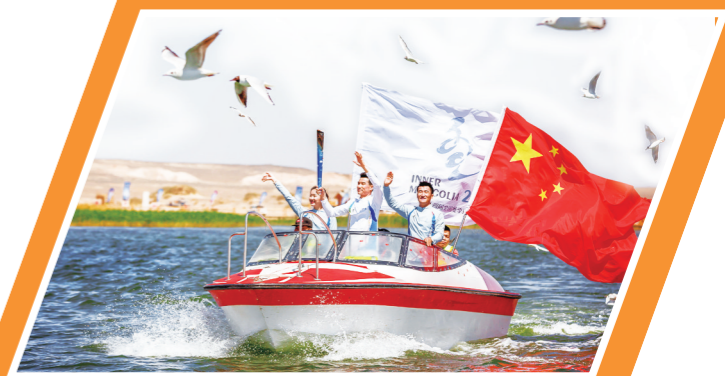
十四冬圣火传递在阿拉善额济纳旗。

近年来,额济纳旗积极落实退役和转业军人安置政策,发放各类补助资金1100余万元。投资59亿元,启动两大基地给排水、道路改造等基础设施建设项目20项。积极承接两大基地社会管理职能,解决编制370个、公益性岗位310个。支持国防和军队建设,协助驻军部队开展试训任务,成功举办全旗各族人民支持航天事业60周年主题图片巡回展。深入开展扫黑除恶专项斗争,有力打击震慑黑恶势力犯罪,不断增强人民群众获得感、幸福感、安全感。全面落实党的民族宗教政策,规范使用蒙古语言文字,各民族大团结的良好局面进一步巩固。达来呼布镇荣获“全国文明村镇”称号,东风镇荣获“全国民族团结进步创建示范乡镇”称号。