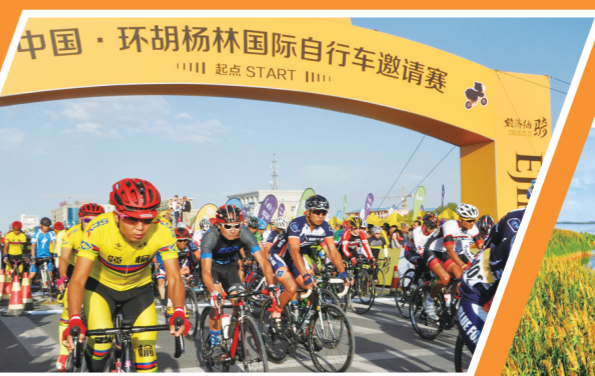
丰富多彩的体育赛事。