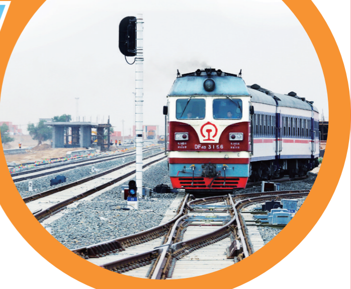
四通八达的交通网络。