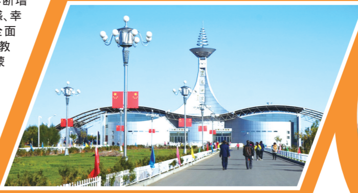
欣欣向荣的策克口岸。