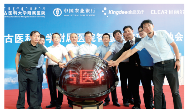
全区首家智慧医院

这是医院智慧服务的升级,也是患者就医感受的升级。提升医疗服务品质,改善患者就医体验,内医附院一直在努力。(乌日娜 陈玲)