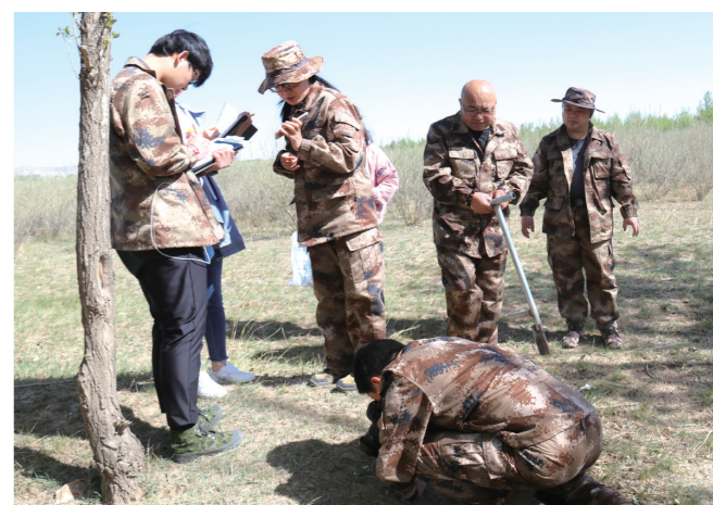
作为技术牵头单位,开展蒙中药资源普查工作。