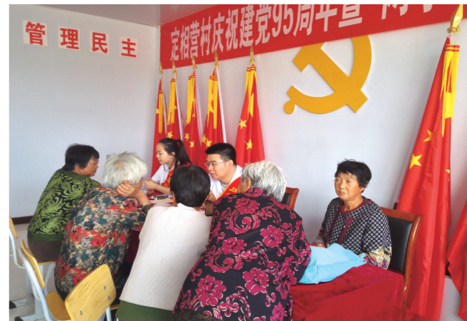
开展主题党日义诊活动。