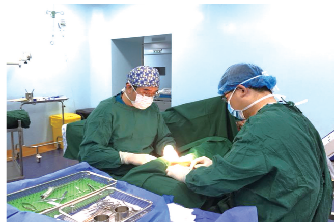
2019年完成自治区首例球囊扩张术。