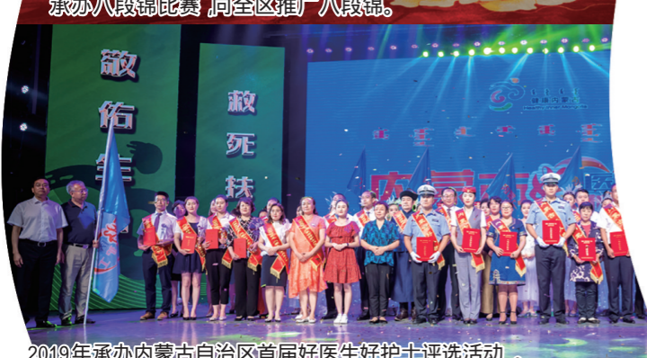
2019年承办内蒙古自治区首届好医生好护士评选活动。