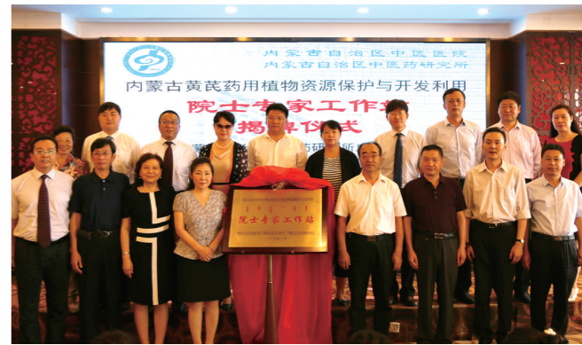
2016年,以中国工程院孙燕院士团队为核心的内蒙古黄芪药用植物资源保护与开发利用院士专家工作站,落户内蒙古自治区中医医院。

山以险峻成其巍峨,海以奔涌成其壮阔。未来,内蒙古中医医院将继续以厚德精医为根本,以传承发展为己任,以护佑健康为使命,以普济苍生为理想,全面提升综合实力,打造中蒙医药特色浓厚、西医能力突出、服务质量一流、自治区领先、国内知名的现代化三级甲等综合性中医医院,以满足人民群众日益增长的医疗服务需求。