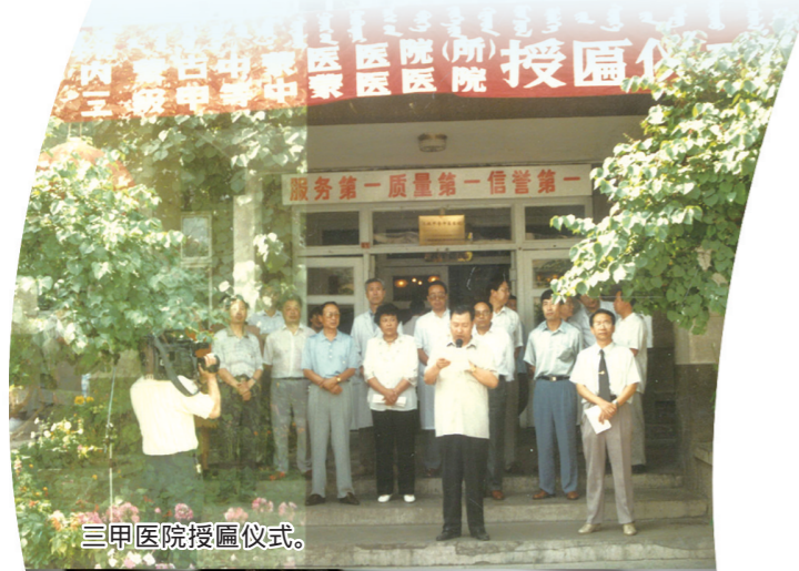
三甲医院授匾仪式。