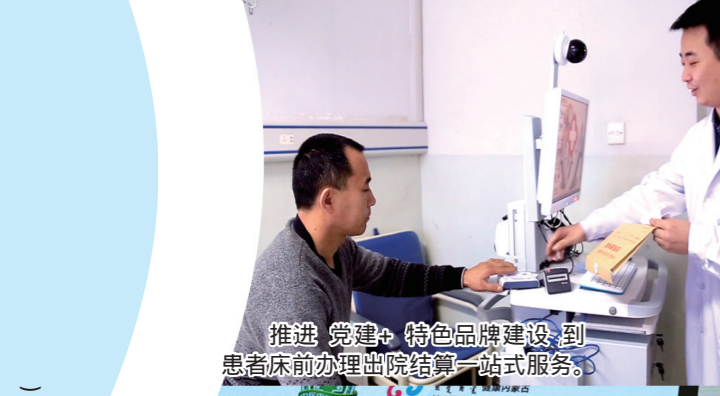
推进“党建+”特色品牌建设,到患者床前办理出院结算一站式服务。