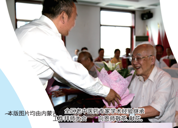
全区老中医药专家学术经验继承工作拜师大会 向恩师敬茶、献花。