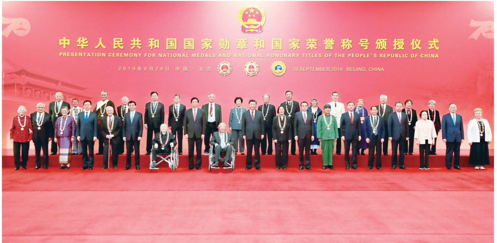
9月29日 中华人民共和国国家勋章和国家荣誉称号颁授仪式在北京人民大会堂金色大厅隆重举行。中共中央总书记、国家主席、中央军委主席习近平向国家勋章和国家荣誉称号获得者颁授勋章奖章并发表重要讲话。