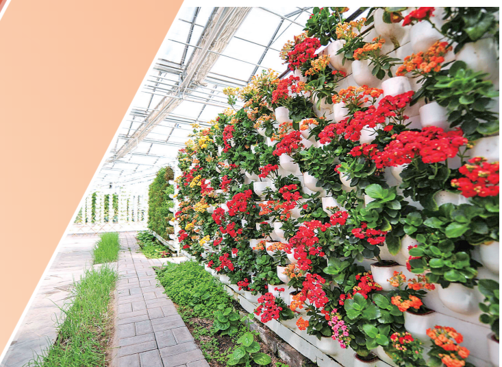
赛罕区现代都市农业园