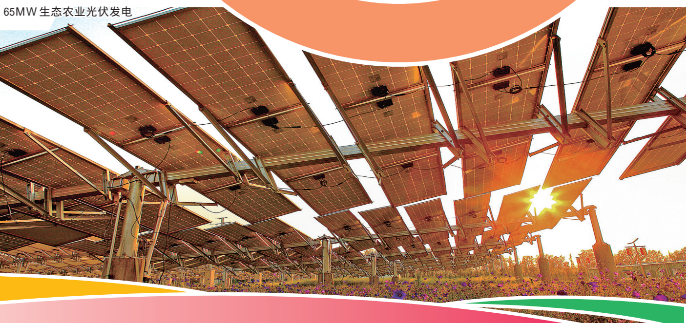
65MW生态农业光伏发电