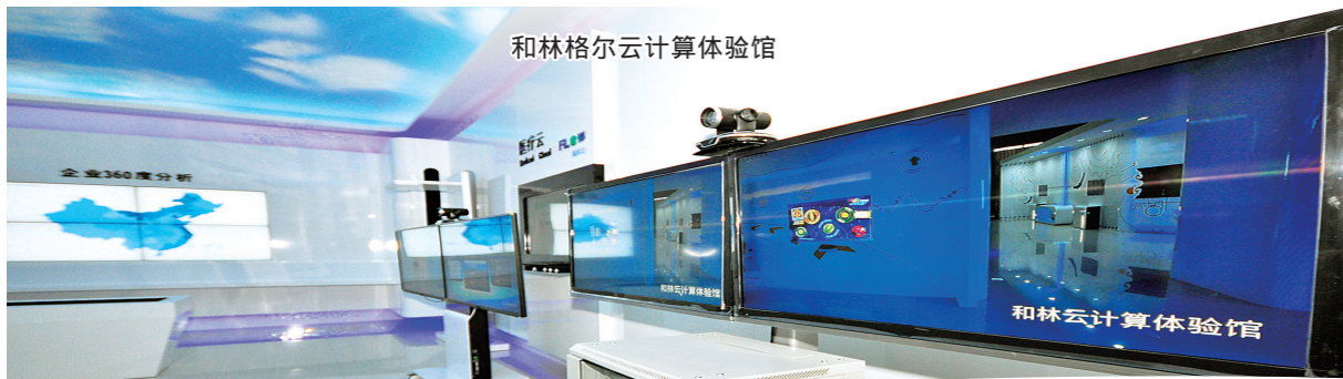
和林格尔云计算体验馆