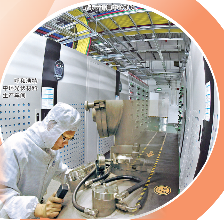
呼和浩特中环光伏材料生产车间