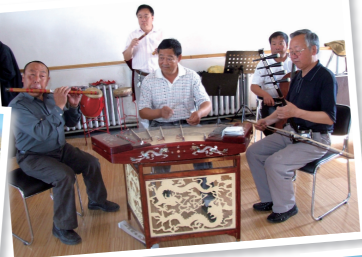
丰富多彩的文化生活。