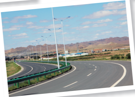
四通八达的交通网络。

新中国成立前夕,全县有水渠61条,吊水井500眼,辘轳井200眼,水车井8眼,低标准水浇地500公顷。新中国成立后,固阳县水利建设发展较快。1952年,县政府召开开渠打井;1957年开始打大口井;1958年开始修水库;1963年建高灌站;1973年开始大规模机电井建设;1986年以后,又搞堤防工程、小流域综合治理以及以水利为中心的农田基本建设。截至1990年,全县共建成水利工程2400多项,发展水浇地14666公顷。阿塔山水库于2008年9月工程开工建设,2011年9月竣工,以供水、防洪为主,总库容量为6464万立方米。2015年,全县有效灌溉面积为30.69万亩,节水灌溉面积29.72万亩。2018年,固阳县重点抓好以农业高效节水灌溉(滴灌)、抗旱应急水源为主的农民增收增效工程和农业供水工程,以农村安全饮水、城镇供水为主的民生工程,以京津风沙源二期工程、中小河流治理为主的生态工程,实施高效节水灌溉项目4.2万亩,新建井房171座,配套水泵171套,排水井1047眼,新建堤防及护岸工程17.328km,新建护井坝6座,泵房11座,铺设管道1.72公里。