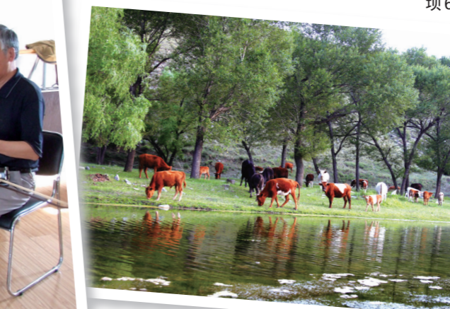
优美宜居的生态环境。

越来越畅通的农村道路交通网络成为了固阳县摆脱贫困的有利条件,昔日的大山贫困村正在悄然发生凤凰涅槃式的蜕变。如今,一条条连接十里八村的镇村公路成为联系党和群众的民心路、助力脱贫攻坚的致富路、服务乡村振兴的希望路。