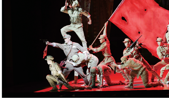
第21届中国上海国际艺术节开幕大戏《战上海》精彩上演

抚今追昔,我们无比自豪;面向未来,我们充满自信。70年来,在中国共产党坚强领导下,中国人民勇于探索、不断实践,成功开辟了中国特色社会主义道路,推动中国特色社会主义进