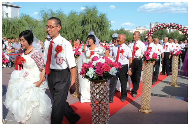
迎泽街道湖西社区共建项目 金色暮年爱满七夕节 同心共圆幸福梦 老年人集体婚礼主题活动。