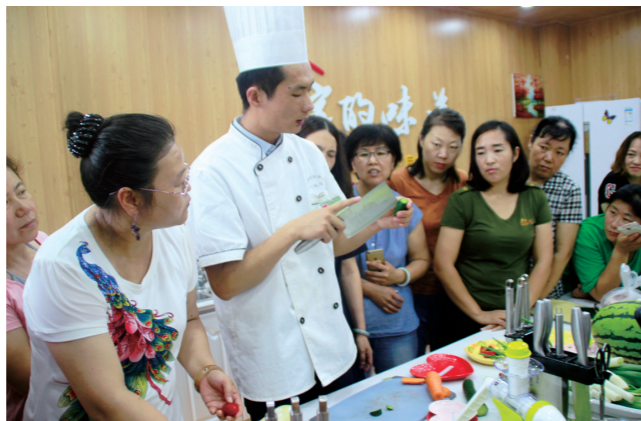
迎泽街道湖西社区共建社会组织承接的爱的分享 家的味道 健康养生厨艺培训购买服务项目。