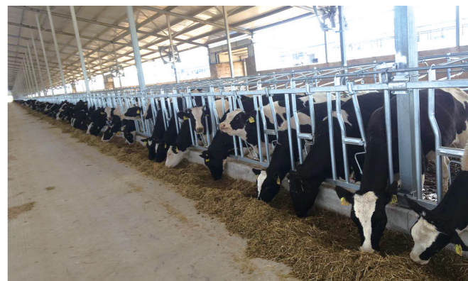
肉牛养殖产业联合体。