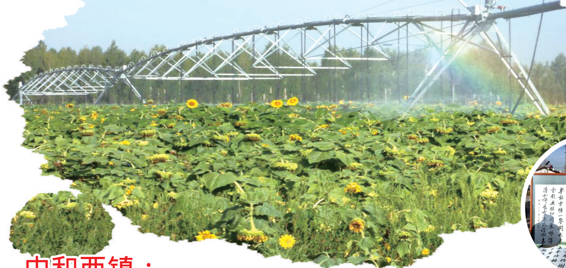
农业综合开发和 中低产田改造项目。