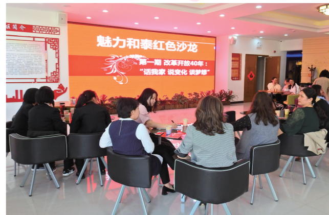
友谊街道和泰社区与共建单位妇女党员开展 话我家 说变化 谈梦想 主题党日活动。