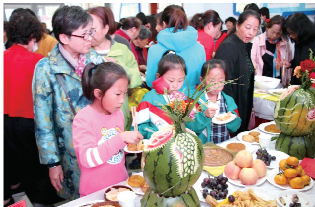
蓝天街道白云社区联合共建单位举办的中秋话传统,和谐邻里情 百家宴活动。