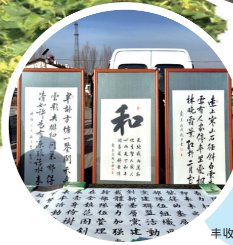
中和西镇第一届农民 丰收节优秀书法作品展示。