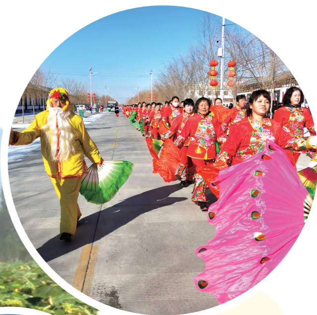
农牧民开展丰富 多彩的文化活动。