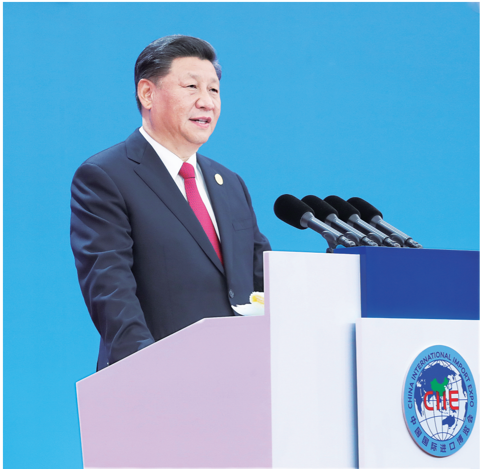
11月5日,第二届中国国际进口博览会在上海国家会展中心开幕。国家主席习近平出席开幕式并发表题为《开放合作 命运与共》的主旨演讲。