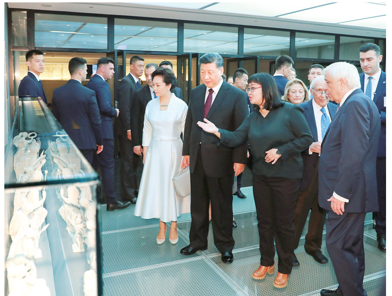
当地时间11月12日,国家主席习近平和夫人彭丽媛在希腊总统帕夫洛普洛斯夫妇陪同下,参观雅典卫城博物馆。

新华社雅典11月12日电 (记者 郝薇薇 黄尹甲子)当地时间11月12日,国家主席习近平和夫人彭丽媛在希腊总统帕夫洛普洛斯夫妇陪同下,参观雅典卫城博物馆。