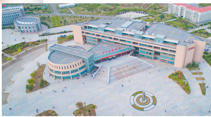
内蒙古财经大学图书馆。李瀚晟 摄