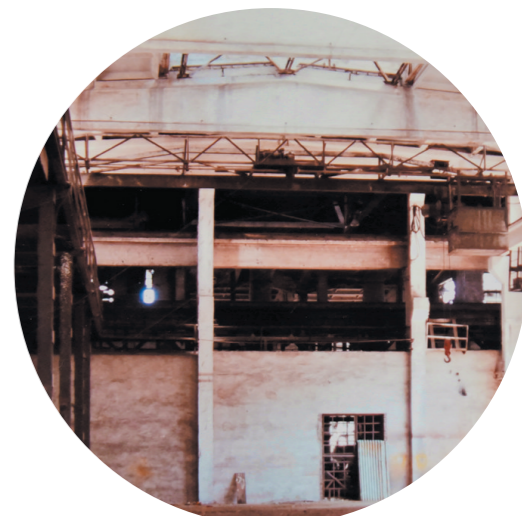
内蒙古工业大学建筑馆原貌。