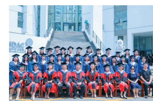
内蒙古师范大学新闻传播学院新闻与传播专业2019届研究生毕业照。