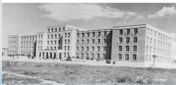
内蒙古大学主楼初建时的面貌。