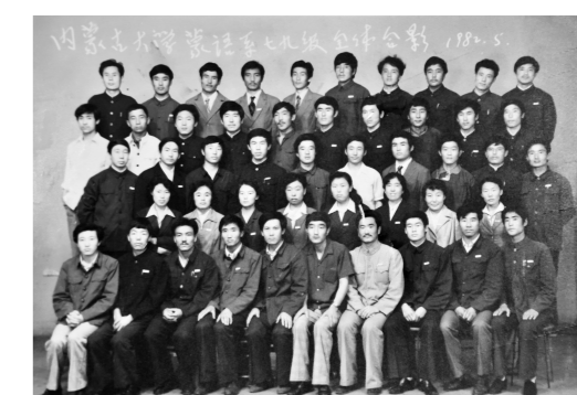
内蒙古大学蒙古语言文学系蒙古语言文学专业1979级毕业照。