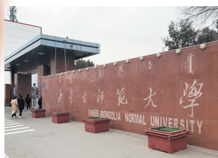
内蒙古师范大学的老校门。