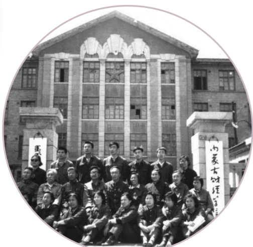
1981年内蒙古财经学院图书馆部分馆员合影。