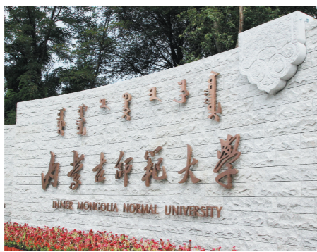
内蒙古师范大学南门今年正式启用。