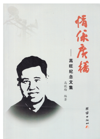
编著:高晓梅 出版社:团结出版社