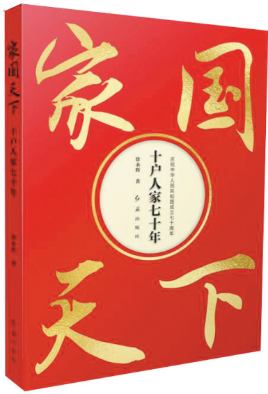
作者:徐永辉 出版社:红旗出版社

长篇报告文学《家国天下:十户人家七十年》,是向新中国成立70周年献礼的图书。从凝聚徐永辉先生毕生心血、跨越70年漫长岁月的数千张照片中精选出300余幅,12万字,历时近2年编辑,于今年4月付梓。作为一部深刻反映时代历史巨变、描绘时代精神图谱的纪实作品,书中展示的一幅幅照片、一篇篇文字,是10户普通人家70年间翻天覆地变化的忠实记录,也是新中国70年繁荣富强的缩影。