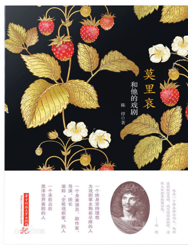
作者:陈惇 出版社:华中科技大学出版社