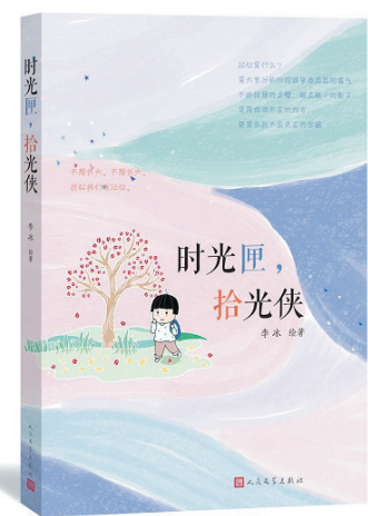
绘著:李冰 出版社:人民文学出版社