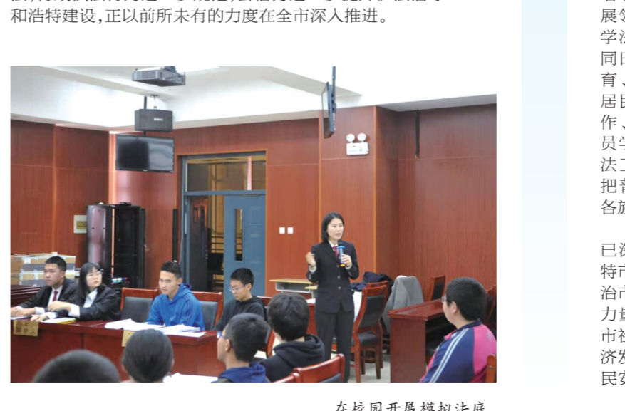
为农村群众开展普法宣传。