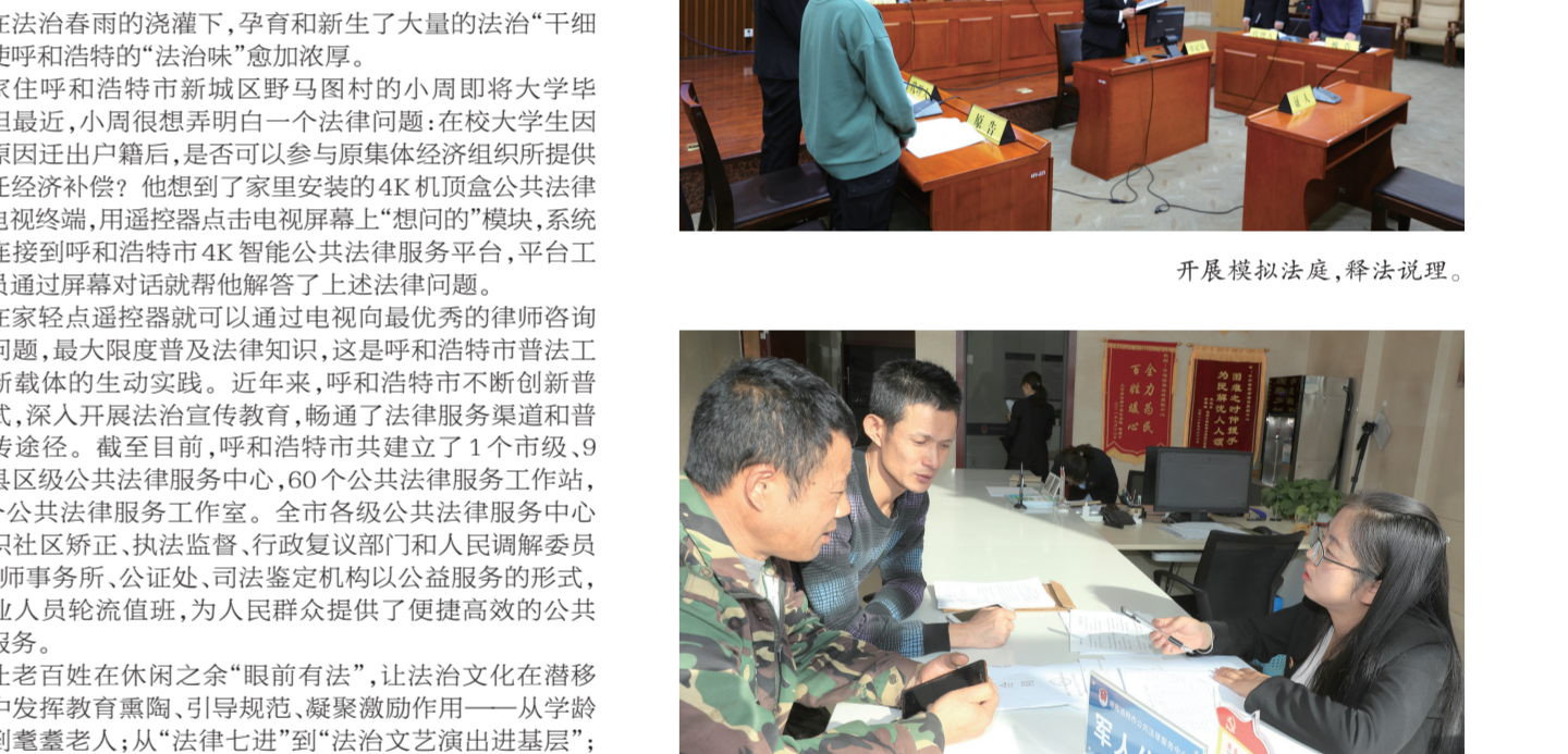
为群众办理相关业务。