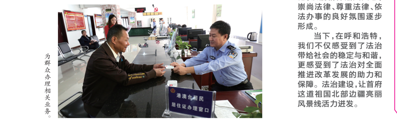
为群众办理相关业务。