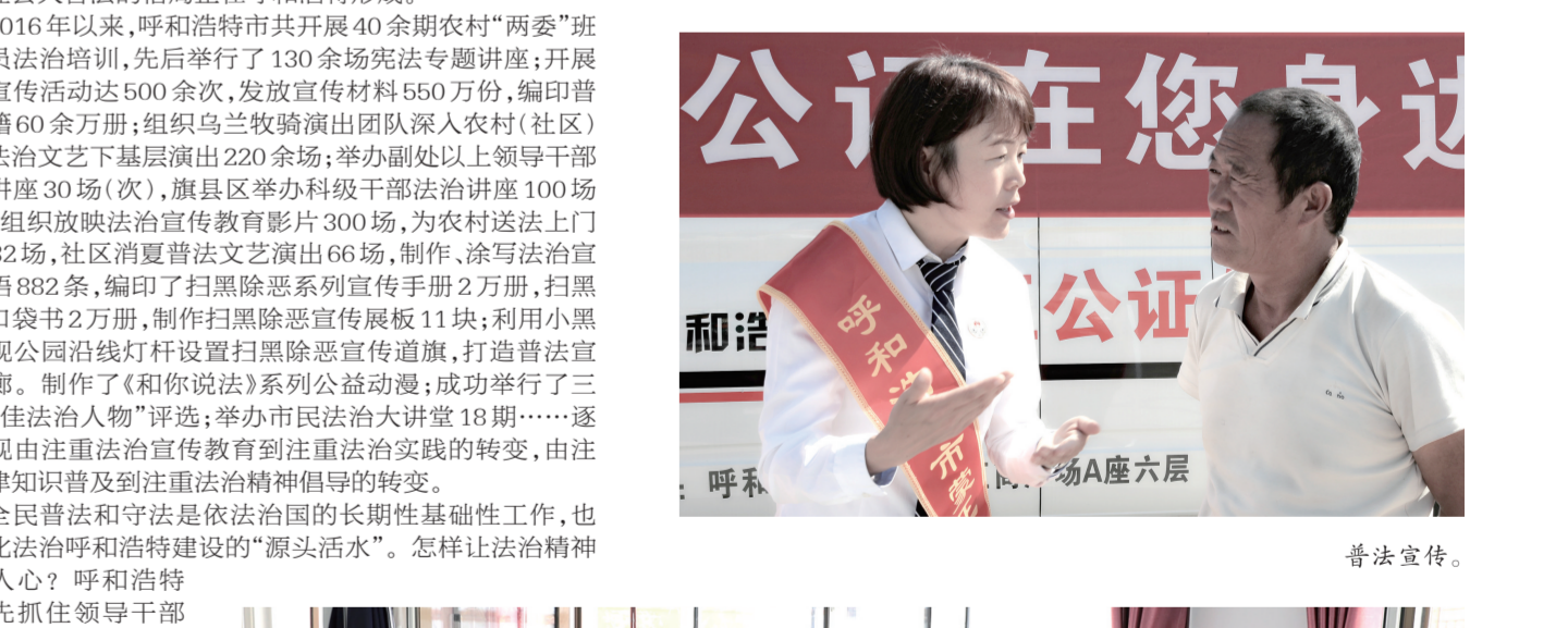
为群众讲解扫黑除恶相关知识。