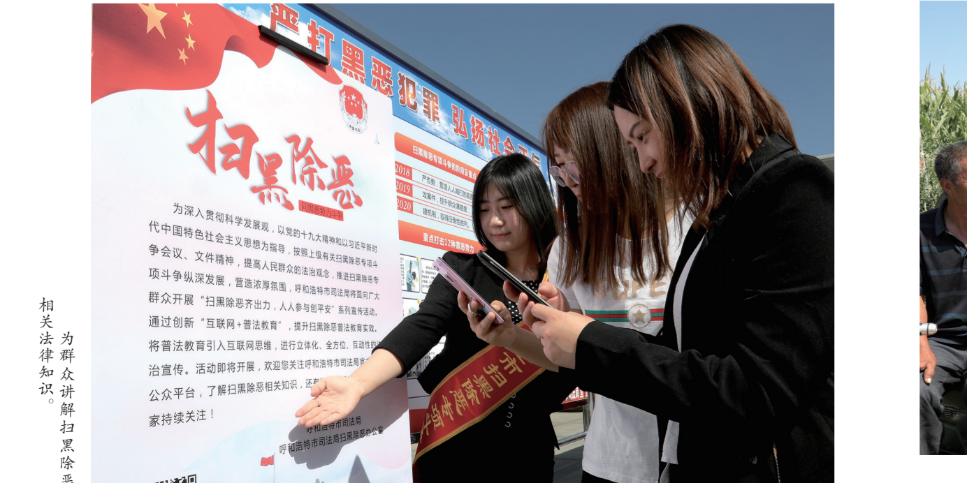
为群众讲解扫黑除恶相关知识。

推进科学立法 为善治奠定良法根基 “小智治事,中智治人,大智立法。”全面推进依法治国,呼和浩特市秉持精准立法、科学立法、民主立法,出台蕴含民生情怀的法律,让法治的光芒照亮了社会的每一个角落,使每一项立法都符合宪法精神、反映人民意志、得到人民拥护。 经内蒙古自治区第十三届人民代表大会常务委员会第十一次会议批准,《呼和浩特市大青山前坡生态保护条例》于2019年4月1日起正式实施。自此,大青山前坡生态保护有了立法保障。 立法,是依法治市的基础。多年来,呼和浩特市人大常委会坚持开门立法、民主立法,对法规草案中的重点问题深入调研,完善立法咨询顾问和立法论证制度,重视听取学者的意见。通过在媒体公布法规草案、寄送征求意见稿等形式,推进法规公开工作常态化。完善立法建议采纳反馈机制,合理吸纳各方面意见。探索开展了立法前后评估工作,为提高立法质量奠定了基础。 《呼和浩特市城市绿化条例》《呼和浩特市民族教育条例》《呼和浩特市清真食品管理条例》《呼和浩特市机动车排气污染防治条例》《呼和浩特市残疾人保障条例》……从群众呼吁,到社会共识,再到立法加以规范;从反复调研到收集民意再到座谈论证,呼和浩特市始终围绕全市发展大局,坚持把立法重点放在推进经济体制改革、改善民生、发展社会事业和政府自身建设方面,科学立法、民主立法。地方立法也实现了由“有法可依”向“好法可依”转变,由“良法善治”跨越,由“粗放型”立法向“精细化”升级。 截至2019年9月,呼和浩特市人大常委会立足市情,紧密结合改革发展实际,共制定地方性法规84件。经过不断修改完善,废旧立新,现行有效地方性法规58件,涉及土地管理、环境保护、交通运输、食品安全、城市管理、民族教育等多个方面,为呼和浩特市经济社会发展提供了强大的法治保障。 在本地特色上下功夫,在有效管用上做文章,呼和浩特市立法工作聚焦全面深化改革,为重大决策提供法治保障。今年,为建立健全最严格最严密生态环境保护制度,呼和浩特市计划修改《呼和浩特市大气污染防治管理条例》,制定《呼和浩特市再生水利用管理条例》《呼和浩特市耕地污染防治办法》;为充分发挥蒙医药资源区位优势,传承蒙医药历史文化,推动蒙医药事业全面协调可持续发展,制定出台了《呼和浩特市蒙医药促进办法》……这些条例、办法涉及经济、生态环境、历史文化等各个方面,为促进首府社会又好又快发展作出了积极贡献。 “让权力在阳光下运行”,如今,在呼和浩特,政务公开透明阳光,老百姓看得见更信得过,在“互联网+”的浪潮下,建立政府网站、开设政务新媒体、接受群众信息公开……公众的知情权、监督权得到有效保障,呼和浩特市依法行政工作驶入快车道。 政务生态日渐清明,法治意识明显增强,各级政府依法行政正在成为常态。依法用权成为重要遵循,把权力关进制度的笼子,行政权力不再任性,行政权力越来越规范。法治给老百姓带来更多获得感,“行政权力”“长途旅行”,百姓办事不再“跑断腿”……法治政府建设结出的累累硕果,让人民群众暖在心里、喜上眉梢。