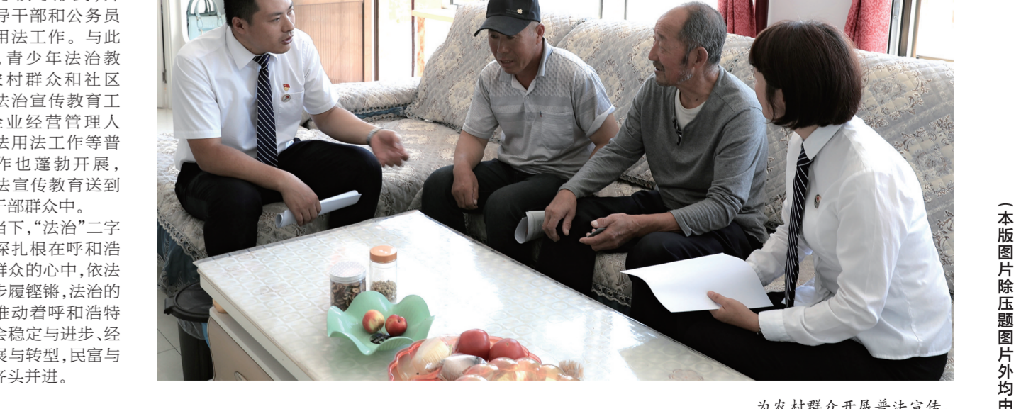
为农村群众开展普法宣传。