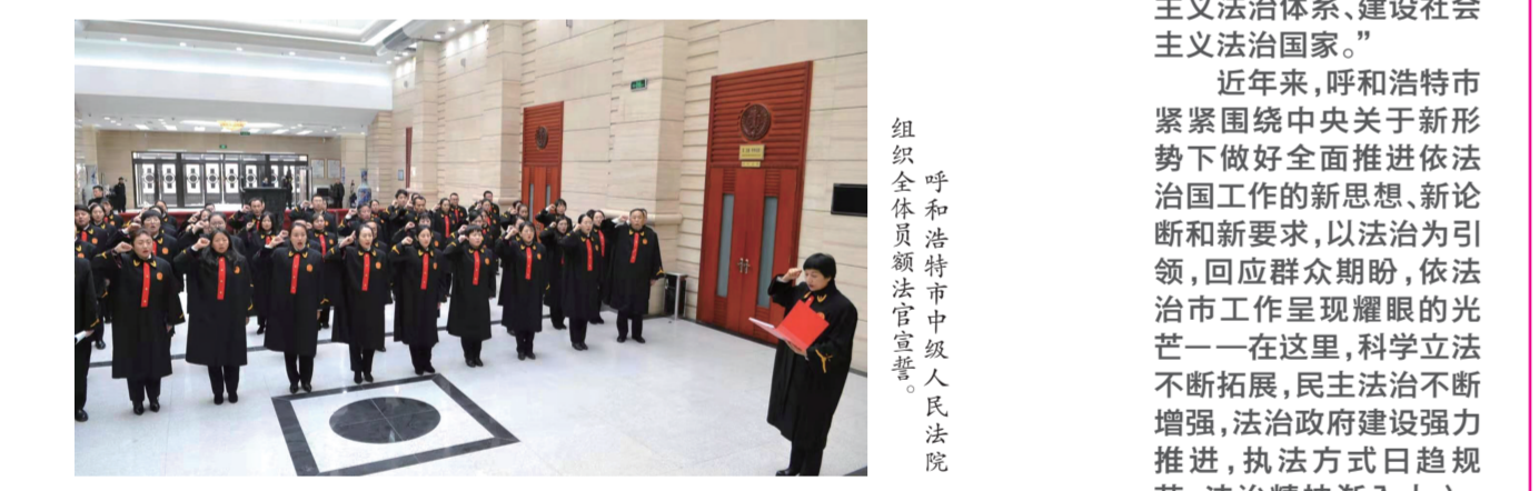
呼和浩特市中级人民法院组织全体干警到法院宣誓。