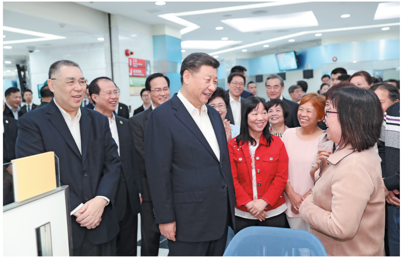
12月19日,国家主席习近平在澳门特别行政区行政长官崔世安陪同下,来到位于澳门黑沙环的政府综合服务中心和濠江中学附属英才学校,同澳门市民和师生亲切交流。这是习近平在黑沙环政府综合服务中心同澳门市民亲切交流。

新华社澳门12月19日电(记者李忠发、朱基钗、郭鑫)19日上午,国家主席习近平在澳门特别行政区行政长官崔世安陪同下,来到位于澳门黑沙环的政府综合服务中心和濠江中学附属英才学校,同澳门市民和师生亲切交流。黑沙环政府综合服务中心于2009年正式投入使用,目前可提供26个政府部门共335项服务。习近平来到服务大厅,在大厅结合展板听取通过整合行政服务资源,为市民提供一站式政务服务的情况。在身份证明和社会保障服务专区,习近平察看相关业务办理流程,并同正在办理业务的市民交谈。在24小时身份证明自助服务区,习近平观看护照业务等办理演示,对通过信息科技手段实现社会治理精细化和公共服务高效化的做法表示肯定。正在办理业务的市民纷纷聚拢过来,习近平同他们一一握手、互致问候。市民们对政府惠民措施十分满