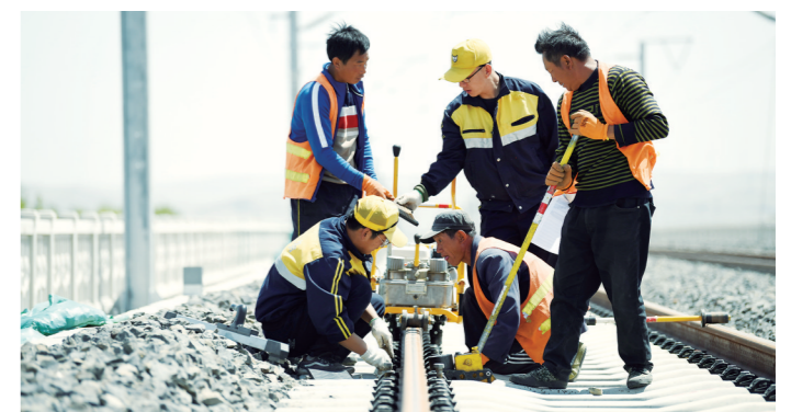
2019年5月14日，中铁路呼和浩特局集团公司集宁工务段职工对高铁线路进行精准调试。