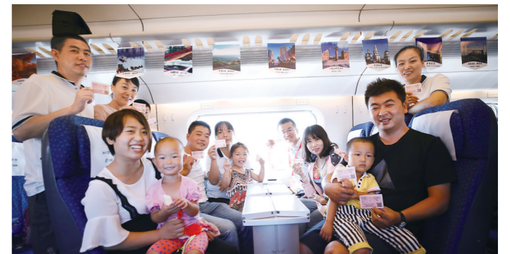
2017年8月3日张呼高铁乌兰察布至呼和浩特东段开通运营。