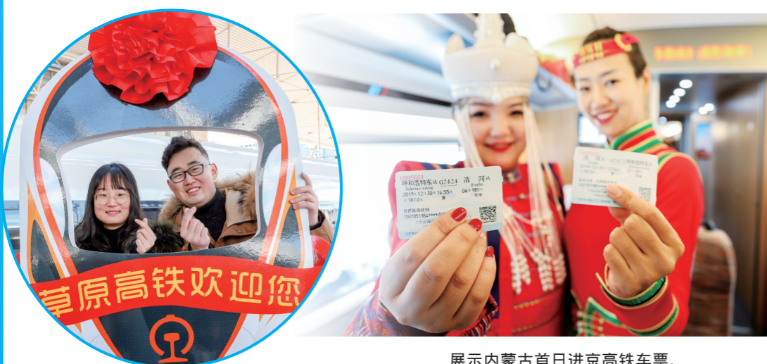
展示内蒙古首日进京高铁车票。