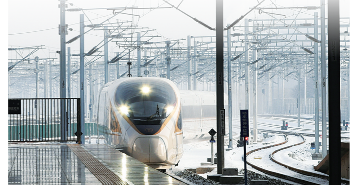
徐徐驶来的复兴号列车。