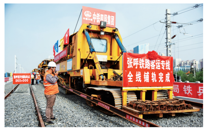
2018年7月31日，张呼铁路客运专线全线铺轨完成。