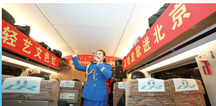
呼铁乌兰牧骑演员为乘客带来精彩演出。