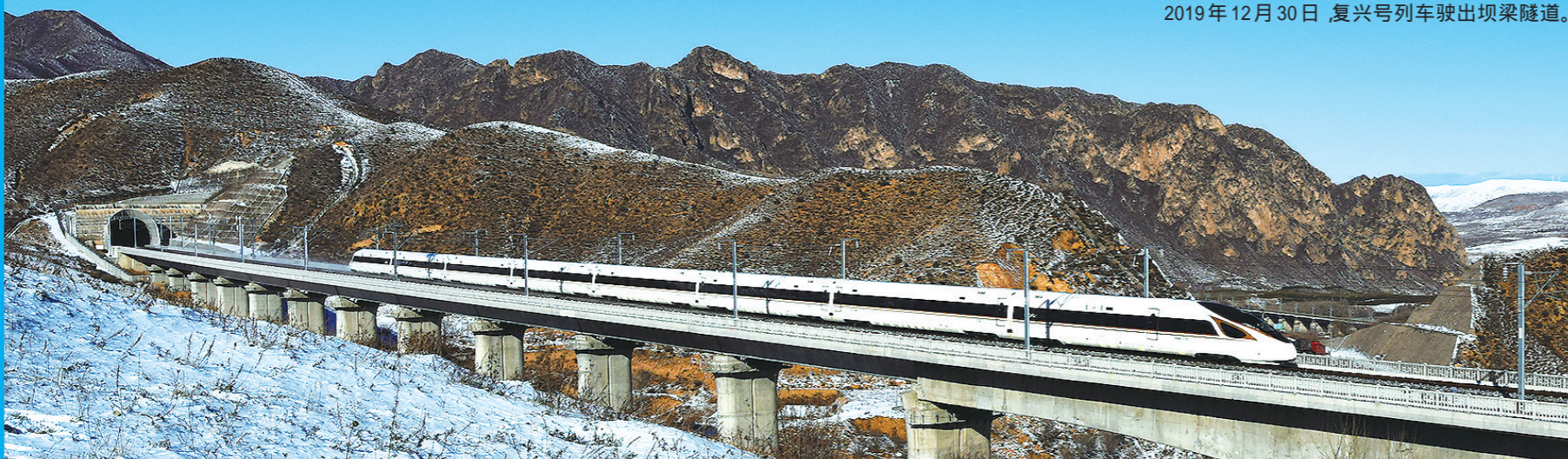
2019年12月30日，复兴号列车驶出坝梁隧道。