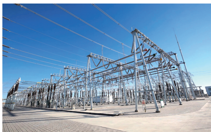
集团公司电网建设成果显著,多项工程获自治区和国家优质工程奖。图为获国家优质工程奖的磴口500千伏变电工程。

2019年,内蒙古电力集团公司自治区党委、政府的正确领导下,坚持党建引领,扎实开展“不忘初心、牢记使命”主题教育,各级党员干部增强“四个意识”、坚定“四个自信”,做到“两个维护”,为推动集团公司高质量发展凝聚起强大力量,提供了坚强保障。全年售电量完成2176.35亿千瓦时,同比增长11.41%,预计增速为全国平均水平的两倍,其中区内售电量1888.85亿千瓦时,同比增长13.6%;全年完成固定资产投资151亿元,“十三五”以来累计完成投资607.3亿元;全网统调装机7368.88万千瓦,相当于消化了1200多万千瓦存量发电装机,建成了“三横四纵”500千伏主干网,形成了东送华北、南送榆林、北送蒙古国的跨区域、跨国境大型坚强电网,电网总体规模、坚强程度、智能化水平、服务保障能力有了显著提升。2019年,集团公司位列中国企业500强第239位,中国能源企业500强第47位。