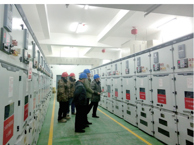
集团公司优化电力营商环境,全面推出“三零三省”服务。图为电力职工验收小微企业配电箱并通电。