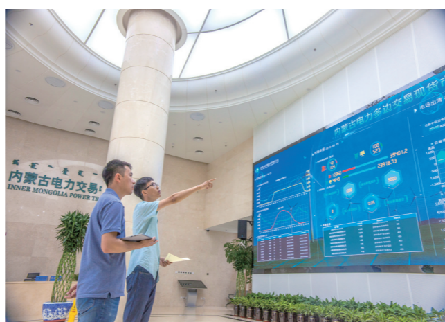
集团公司深化改革创新,探索开展电力现货市场模拟及结算试运行。图为内蒙古电力多边交易大厅。

实干成就梦想,奋斗铸就辉煌。2020年是全面建成小康社会和“十三五”规划收官之年,集团公司将坚持以习近平新时代中国特色社会主义思想为指导,深入贯彻党的十九届四中全会精神,认真落实自治区党委、政府各项决策部署,继续往实里走,接续奋斗,稳中求进,守正创新,坚定不移探索以生态优先、绿色发展为导向的高质量发展新路子,全力以赴助推自治区现代能源经济发展,努力为建设亮丽内蒙古,共圆伟大中国梦作出新的更大贡献。