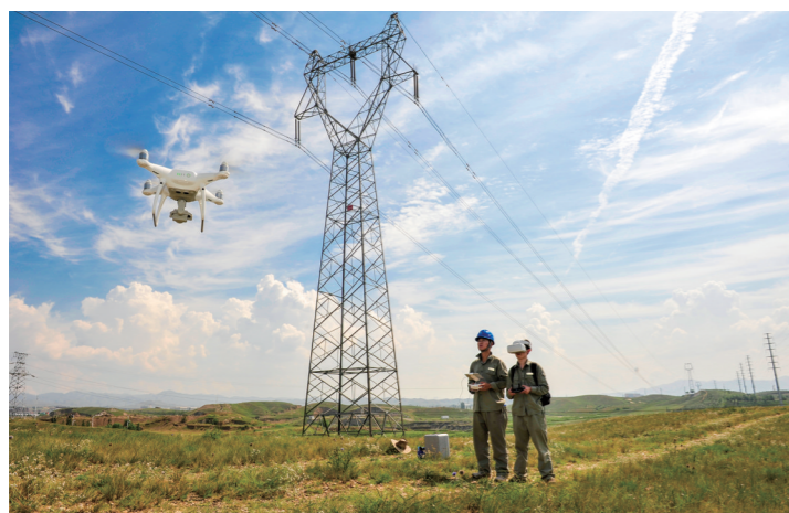
集团公司坚持科技创新,构建立体智能巡检体系。图为电力职工操作无人机巡检线路。