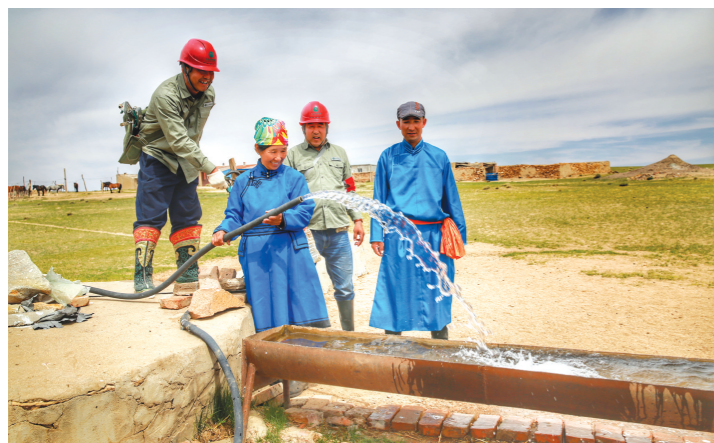
集团公司加快贫困地区电力设施建设,为农牧民生产生活提供电力保障。图为电力职工为牧民家的机电井通电。