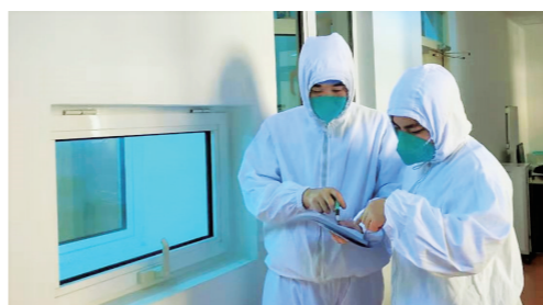
认真记录患者的指标检测数据。