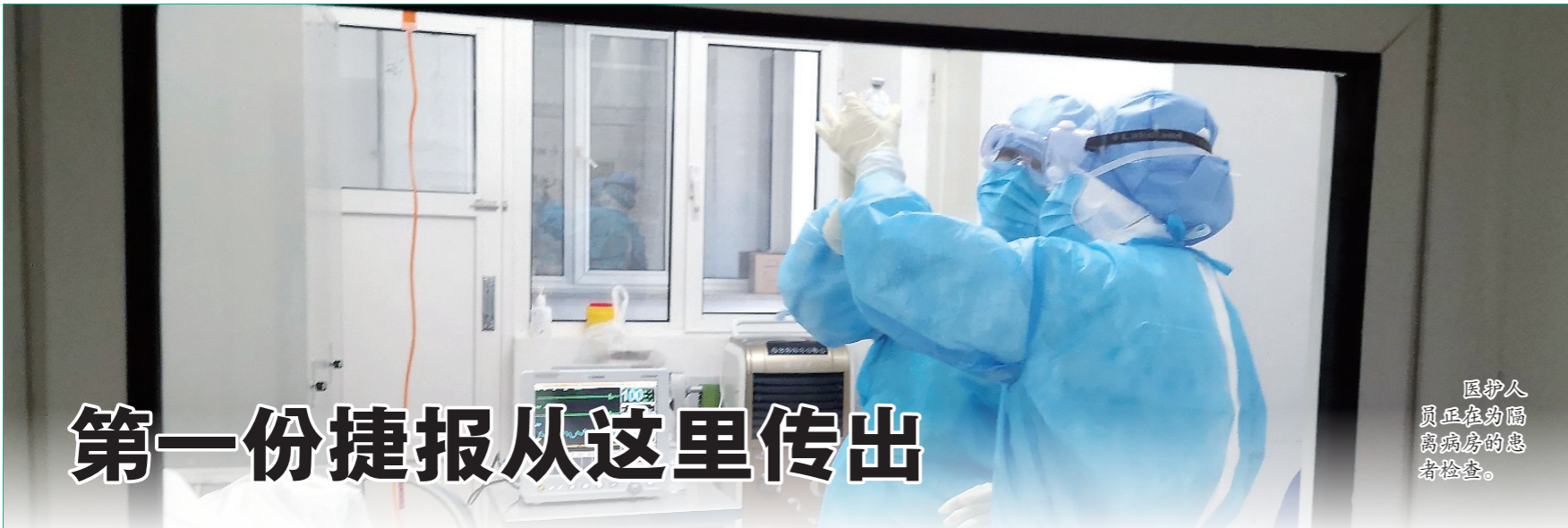
医护人员正在为隔离病房的患者检查。