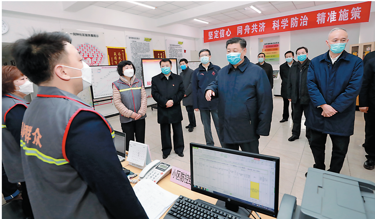
2月10日，中共中央总书记、国家主席、中央军委主席习近平在北京调研指导新冠肺炎疫情防控工作。这是习近平在朝阳区安贞街道安华里社区，了解基层一线疫情联防联控情况。

疗中心，习近平通过视频连线武汉市收治新冠肺炎患者的金银潭医院、协和医院、火神山医院，向疫情防控一线的医务工作者、干部职工和解放军指战员了解情况、听取意见和建议。他强调，全国广大医务工作者要不忘初心、牢记使命，响应党的号召，义无反顾冲上疫情防控第一线，同时间赛跑，与病