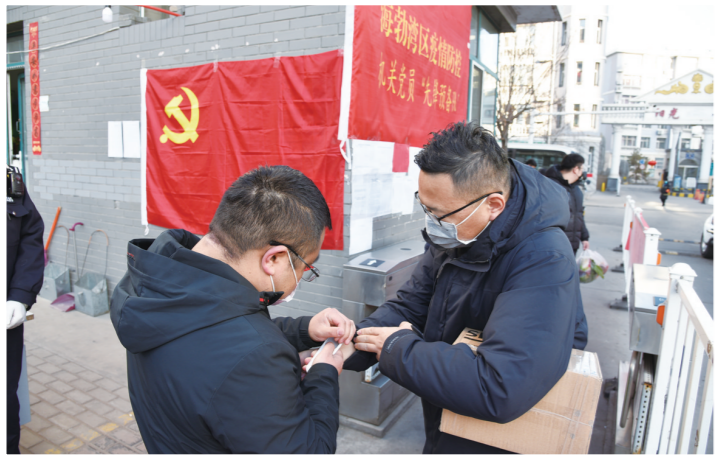
党员服务队为进入小区人员测量体温。