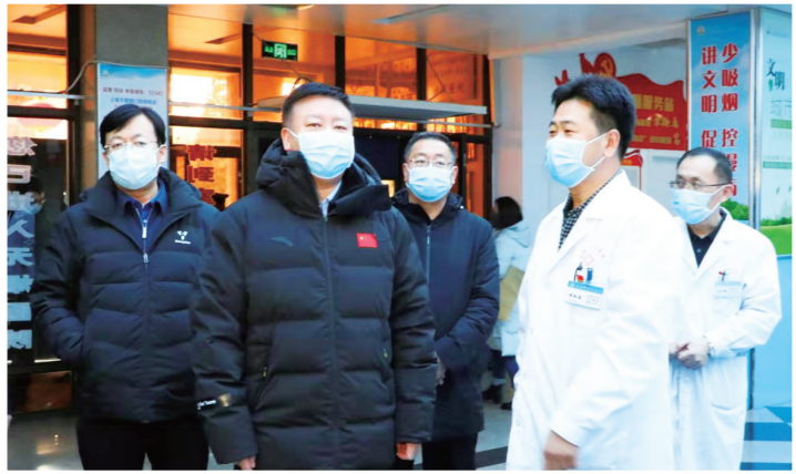
乌海市委书记史万钧(左二)在乌海市人民医院检查疫情防控工作。

新型冠状病毒感染的肺炎疫情暴发以来,乌海市迅速行动,全市1900多个党组织3万余名党员挺身而出、迎难而上,勇做“逆行者”,深入疫情防控一线发挥先锋模范作用,让每个支部都成为一座坚实的堡垒,每个党员都成为一面鲜红的旗帜。