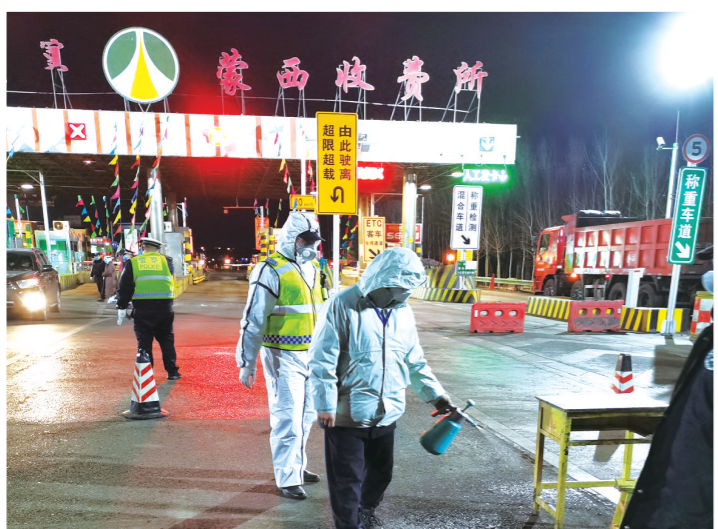
国家税务总局乌海市海勃湾区分局党员突击队深夜值守。