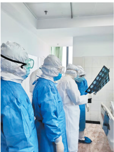
我区首批援助湖北医护人员在研究病例。

2月14日,我区首批援助湖北医疗队的139名医护人员在荆门已经工作近20天了,忙碌的白衣战士们每天都在与疫情战斗,无暇顾及安危、无暇思念家乡。危急、抢救、心疼、感恩……通过连线,医护人员们讲的每一个细节,都深深地刻在了我们心里。