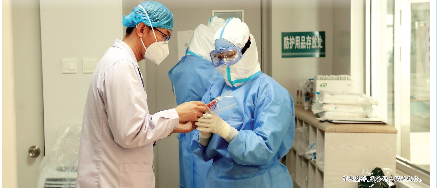
穿戴整齐,准备进入隔离病房。