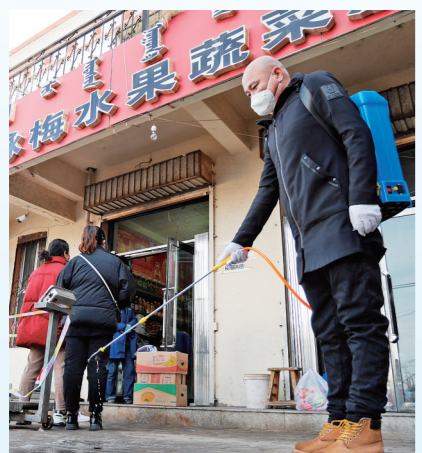
鄂尔多斯市鄂托克旗对菜市场等重点场所严格进行消毒防疫。