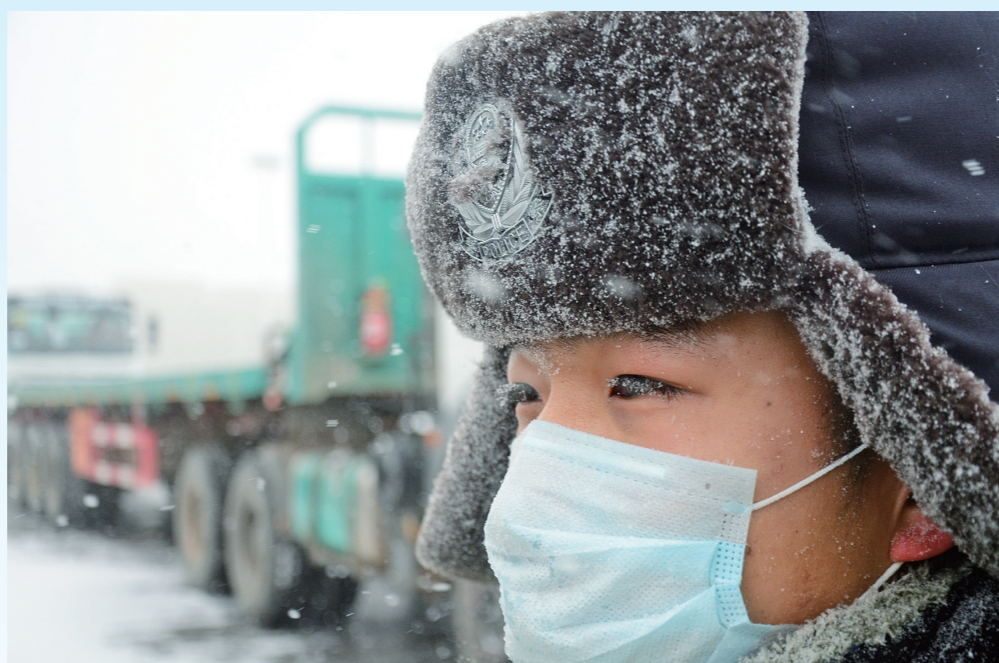
甘其毛都出入境边防检查站执勤民警在风雪中坚守抗疫一线确保口岸畅通。