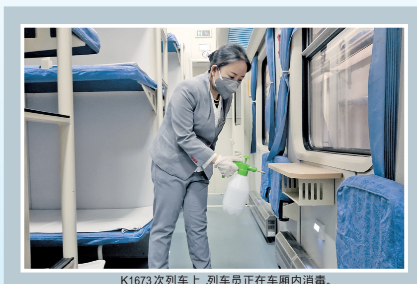
K1673次列车上，列车员正在车厢内消毒。

户外值守冻得通红的脸蛋、测温抬了数千次的胳膊、走街串巷奔忙的脚步，在疫情防控第一线，广大基层工作者挺身而出、冲锋陷阵，以逆行姿态坚守疫情阻击战场。