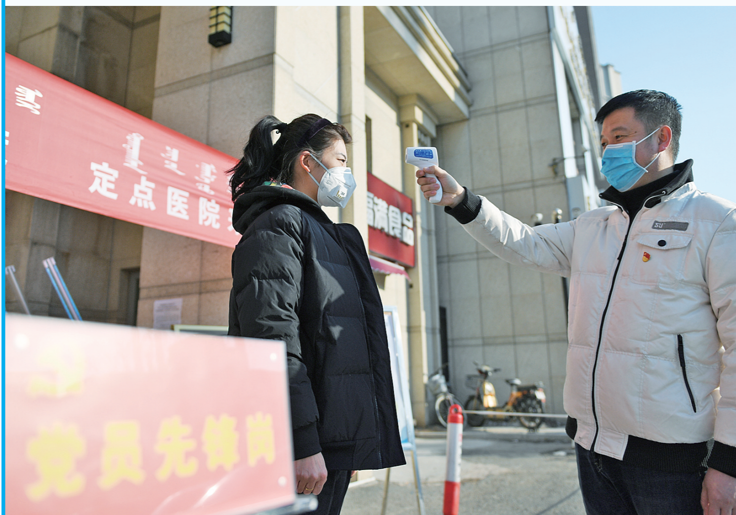
党员志愿者在小区门前为出入人员测体温。