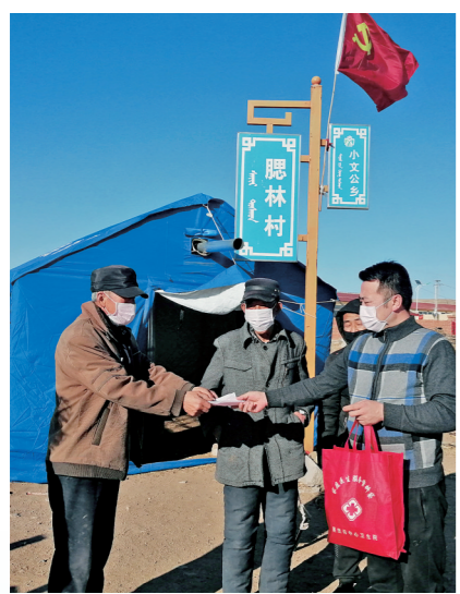
包头市达茂旗小文公乡腮林村向村民发放400只口罩，并利用流动宣传车普及新冠肺炎预防知识。