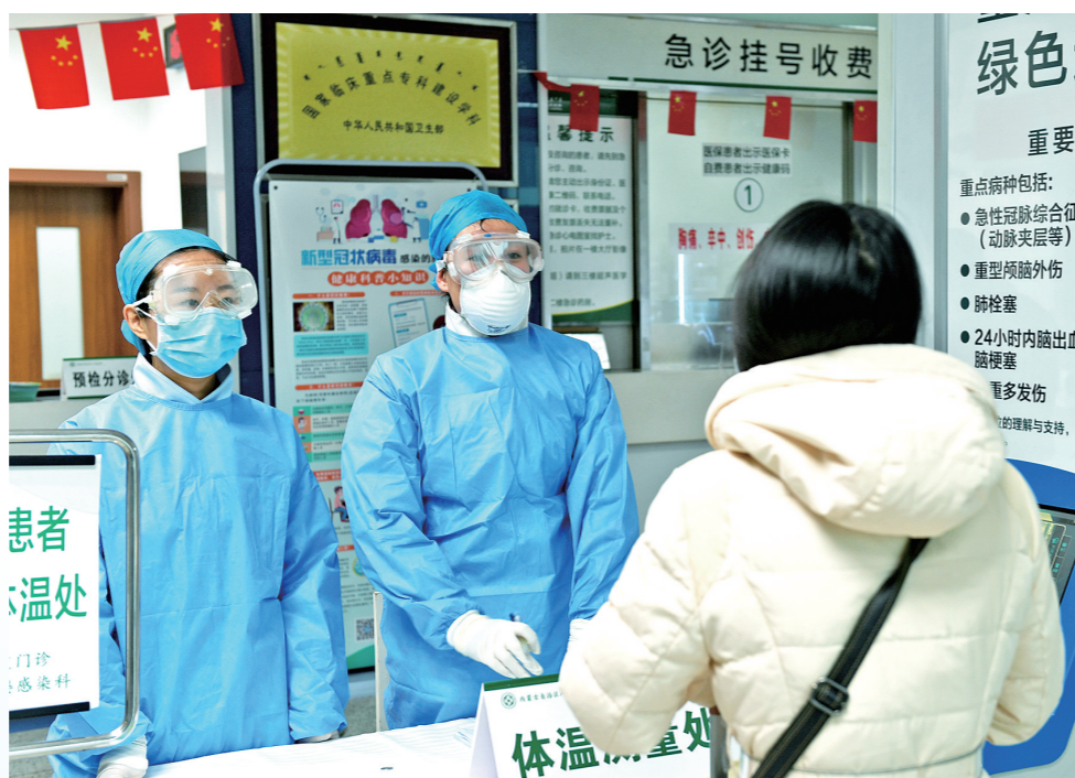
医护人员严格落实预检分诊制度，做好发热病人登记工作。