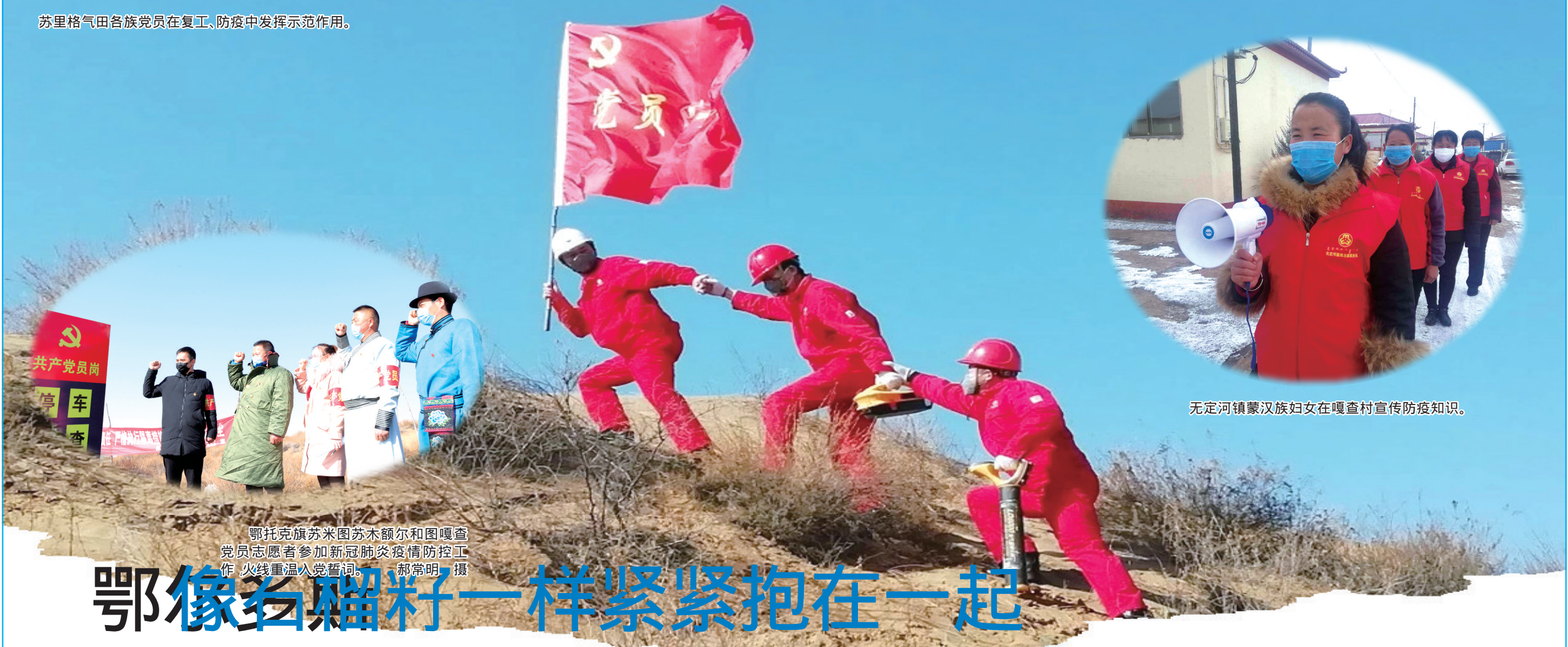
鄂托克旗苏米图苏木额尔和图嘎查党员志愿者参加新冠肺炎疫情防控工作,火线重温入党誓词。