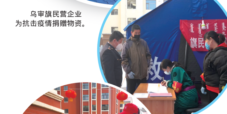
志愿者站岗,严把小区卡口。