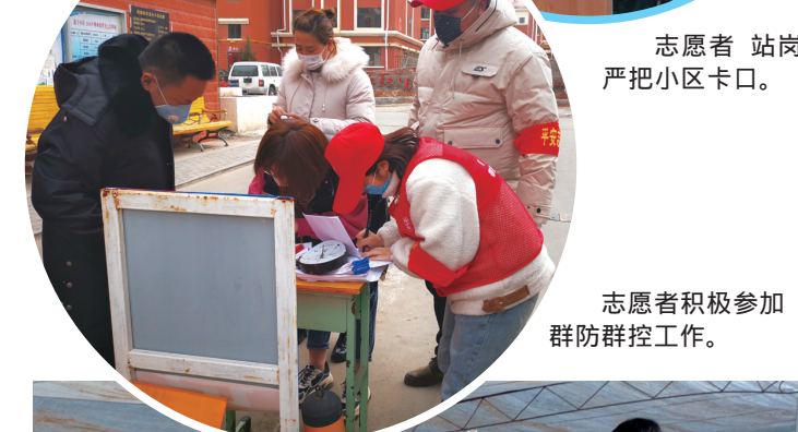
志愿者积极参加群防群控工作。