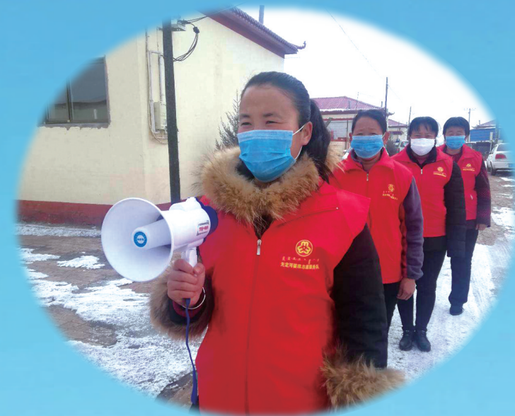
无定河镇蒙汉族妇女在嘎查村宣传防疫知识。

一直以来,这片土地像爱护自己的眼睛一样,爱护民族团结,今天,200万各族群众像石榴籽一样紧紧抱在一起,奋力战疫。没有哪一个春天不会如约而至,正如吉仁苏布德、葛小虎、马兰花等各族歌手唱响的《相信一切都会过去》疫情当前,大爱无边,万众一心,迎接春天。