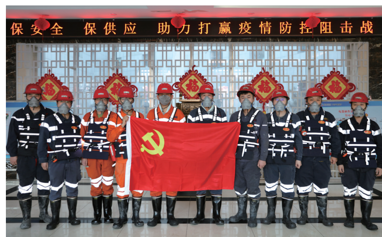
2月6日,中天合创煤炭分公司葫芦素煤矿党员突击队开展“保安全 保供应 助力打赢疫情防控阻击战”活动。