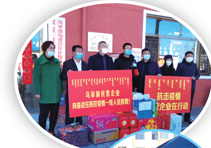
乌审旗民营企业为抗击疫情捐赠物资。