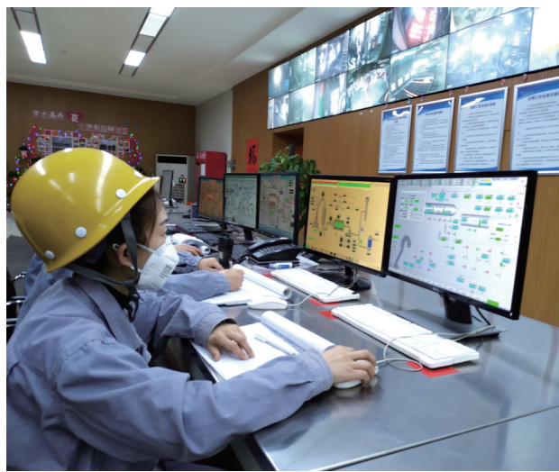
企业复产。

没有一个冬天不可逾越,没有一个春天不会到来!越是特殊时期、艰难时刻,越要政企联动、共克时艰。在坚持科学防控、精准施策,抓实各项防控措施前提下,积极稳妥有序推进企业复工复产,切实做到疫情防控和复工复产两手抓两不误,确保打赢经济稳增长这场硬仗,乌海必将在统筹推进疫情防控和经济社会发展工作这场大战大考中交出合格答卷。