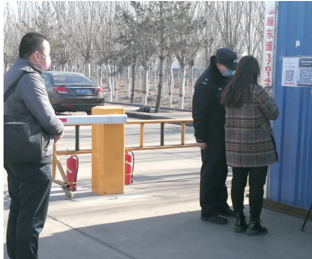
华资煤焦化公司员工返岗前扫码登记。