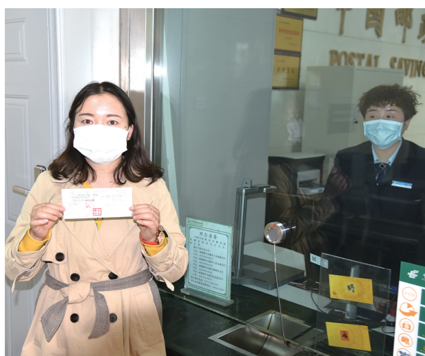
一家旅游企业获进质保金缓解经营困难。