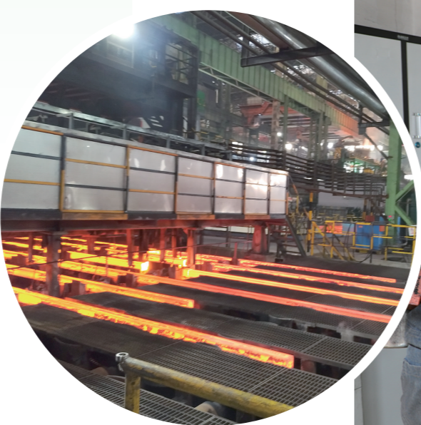
包钢万腾开工复产。