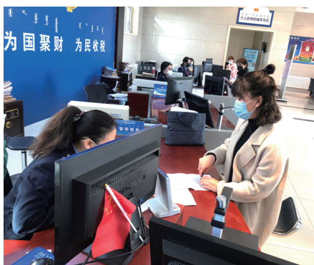
海勃湾区税务局采取网上和大厅限号办理业务。