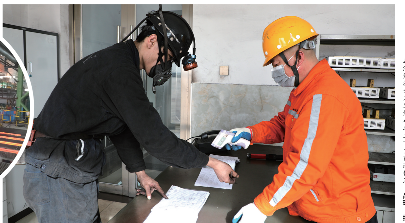
乌海能源老石旦煤矿职工下井前测体温。