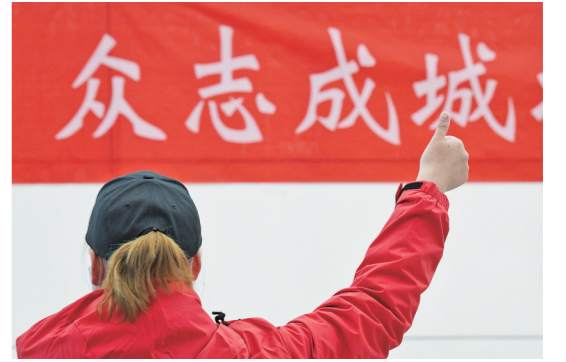
坚定信心。