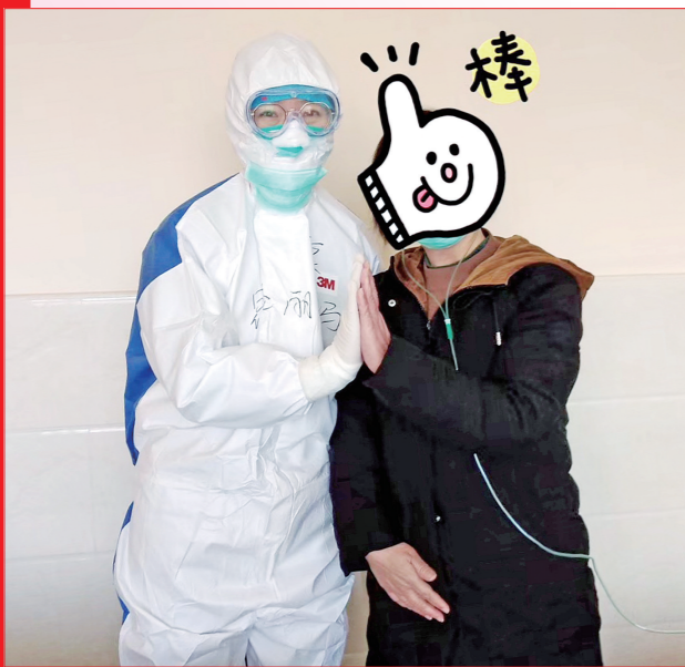
昂格丽玛与治愈患者合影。