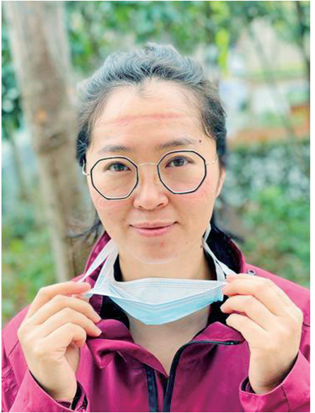
每一道勒痕都是一枚勋章。