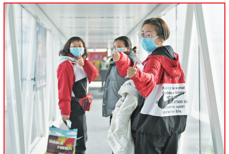
最美逆行。