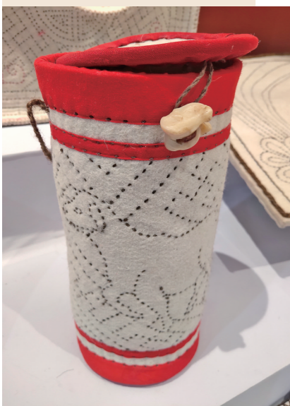
充满设计感的毡绣制品。