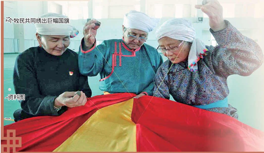
牧民共同绣出巨幅国旗