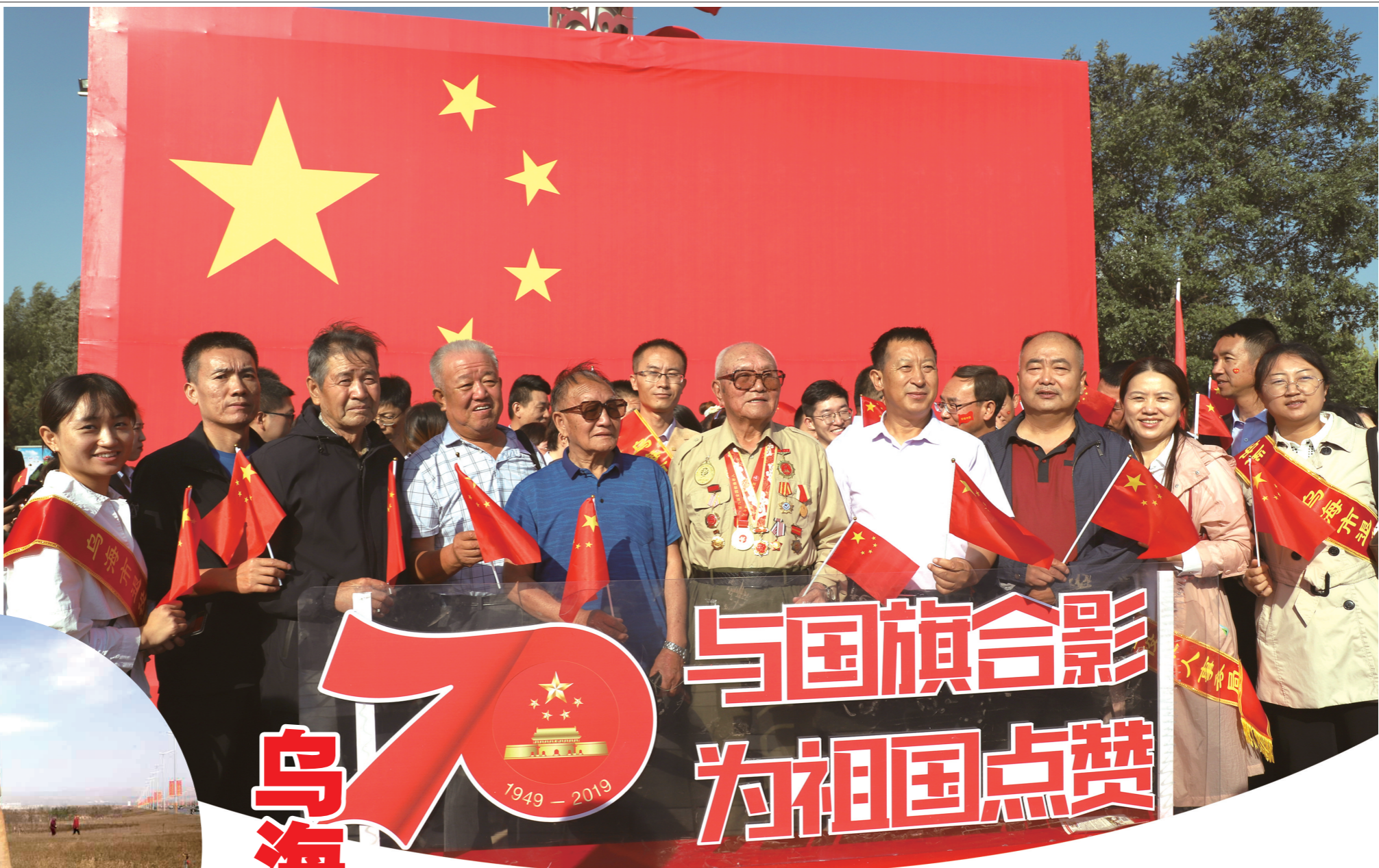
心系老兵,双拥情深。

近年来,乌海市深入学习贯彻习近平总书记关于做好新时代双拥工作的重要论述和重要指示批示精神,按照党中央、国务院、中央军委各项决策部署和自治区党委、政府、内蒙古军区关于加强军政军民团结的指示要求,以创建双拥模范城为目标,以落实双拥优抚安置政策为重点,创新发展新时代双拥工作,全市上下形成了军民一家亲的良好氛围,有力支持了国防和军队现代化建设。