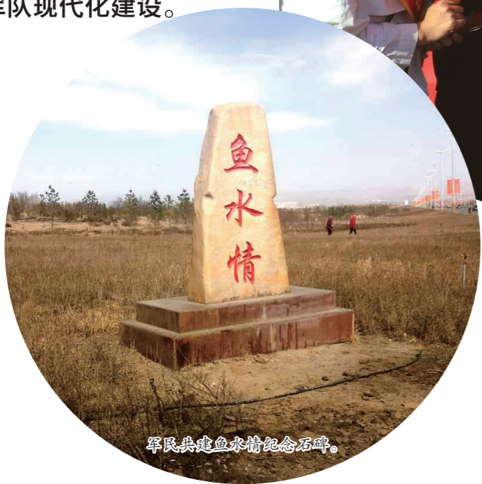
军民共建鱼水情纪念碑。