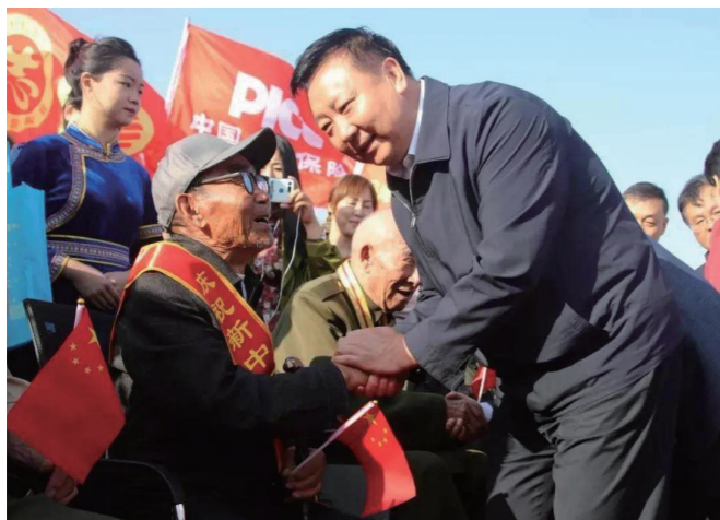
乌海市委书记史万钧与老战士亲切握手。

新冠肺炎疫情防控期间,乌海市退役军人事务局组建了3个工作组,建立了值班值守、应急处置、信息共享等机制,及时组织开展各项应急处置,层层落实疫情防控责任。第一时间组建“乌海市退役军人抗击疫情应急救援突击队”,共及时处置物资转运等应急任务40多次,参与了全市140多个路口、点位的封控值守任务。在该市退役军人事务局的倡议带动下,全市广大退役军人积极行动、各尽所能,共捐款捐物3.2万多元,为值班值守人员免费送餐,捐赠水果、口罩、酒精等物资不计其数,并涌现出了乔高磊、马风清、张伟、王贺、谢冬梅、郝磊等一批退役军人先进典型。