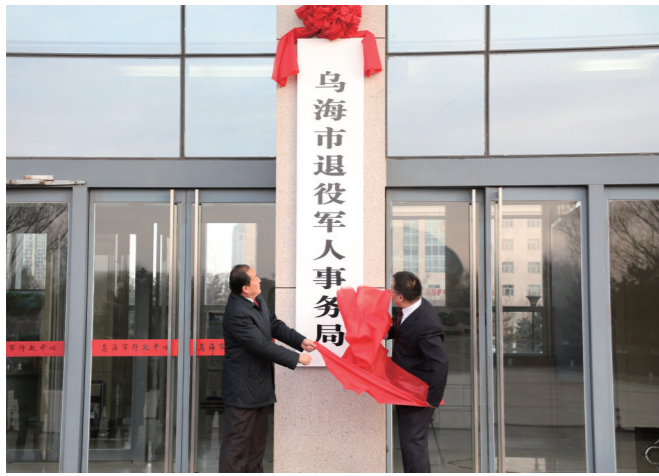
乌海市退役军人事务局挂牌成立。