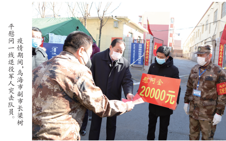
疫情期间,乌海市副市长梁树平慰问一线退役军人突击队员。