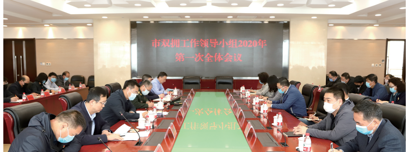
2020年乌海市双拥工作领导小组第一次全体会议。