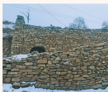
石头垒砌的院墙,石片铺就的坡道。