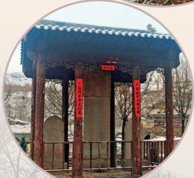
口子上村的四公主德政碑