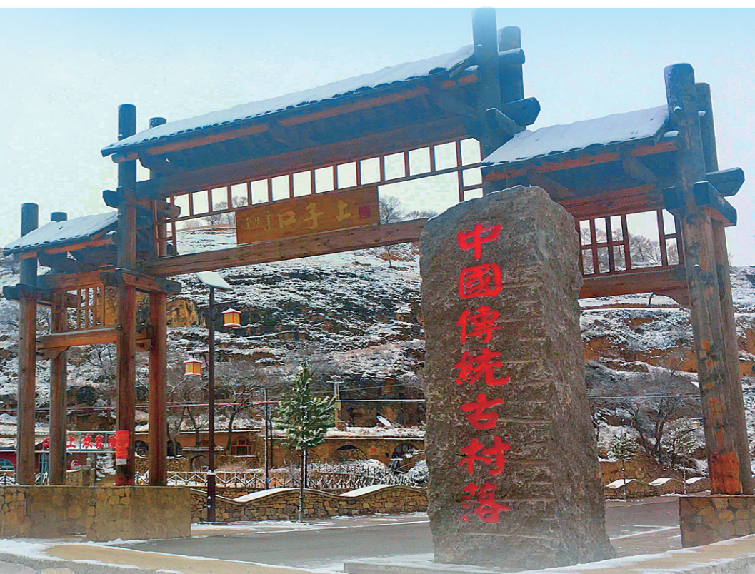
中国传统村落 口子上村。