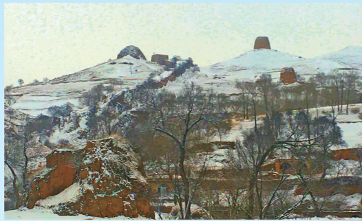
口子上村明长城遗址。