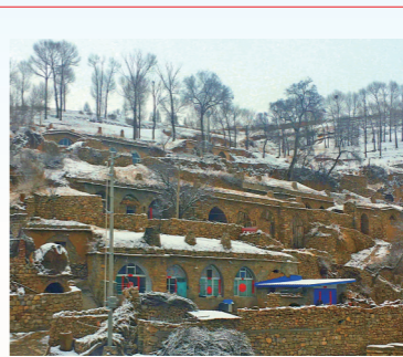
窑洞背山面水,参差错落。