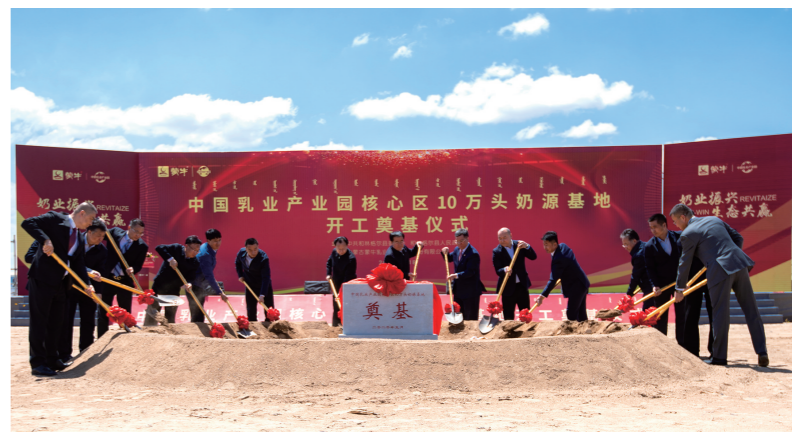
中国乳业产业园核心区10万头奶源基地开工奠基仪式。