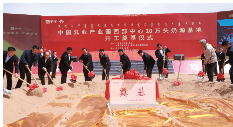
中国乳业产业园西部中心10万头奶源基地开工奠基仪式。