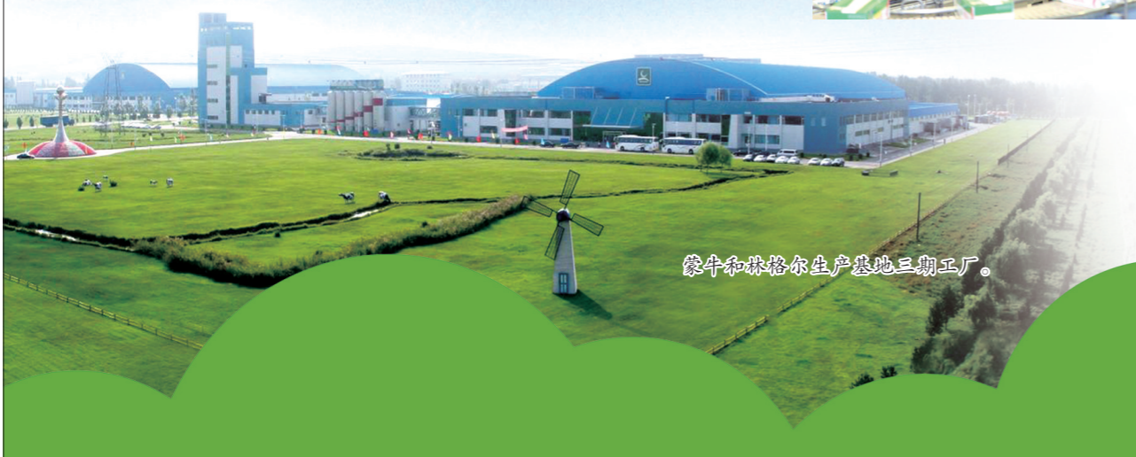
蒙牛和林格尔生产基地三期工厂。