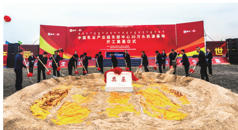
中国乳业产业园东部中心10万头奶源基地开工奠基仪式。