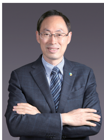
中粮集团总裁于旭波。