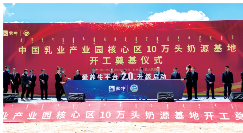
爱养牛平台2.0升级启动。

在国家、行业和社会的支持、参与下,相信中国乳业产业园将充分释放集群效能和改革动能,为中国乳业做优做强、在世界竞争格局中成功突围贡献应有的力量。