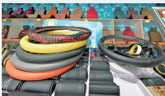
特殊工人们制作的汽车用品出炉。

助残脱贫,决胜小康。中国有几千万残疾人,要全面建成小康社会,残疾人一个也不能少。比起健全人无疑需要更多的社会资源和制度保障。发动残疾人以自强不息的精神实现自身的人生价值,他们将会成为打赢脱贫攻坚战的关键力量,也是全面建成小康社会的见证者和参与者。