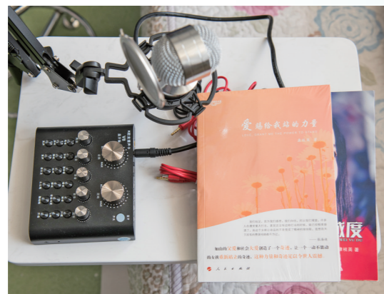
励志故事里充满感动。