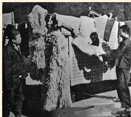
张库大道的皮毛交易。(资料图)