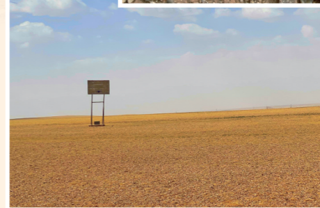
张库大道边的篮球架。