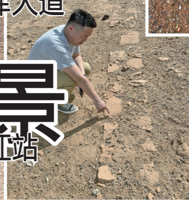
涝江驿站房屋基址。