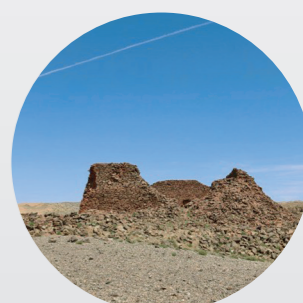
乌兰布拉格障城遗址。