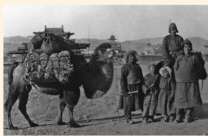
张库大道上的赶驼人。(资料图)