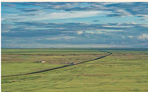
乌珠穆沁草原上的101省道。