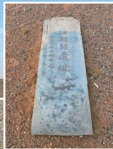
1985年的涝江驿站遗址标志碑。