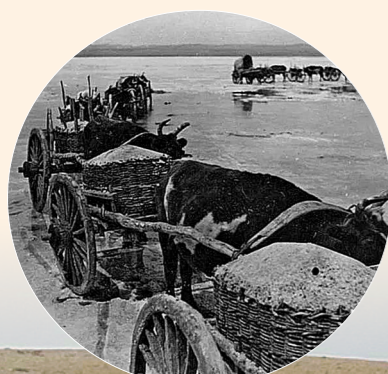
上世纪三十年代额吉淖尔盐池的运盐牛车。(资料图)