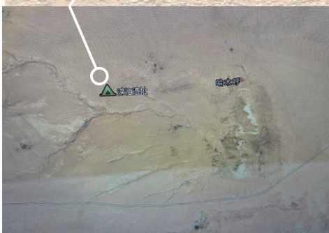
卫星地图上的涝江遗址。