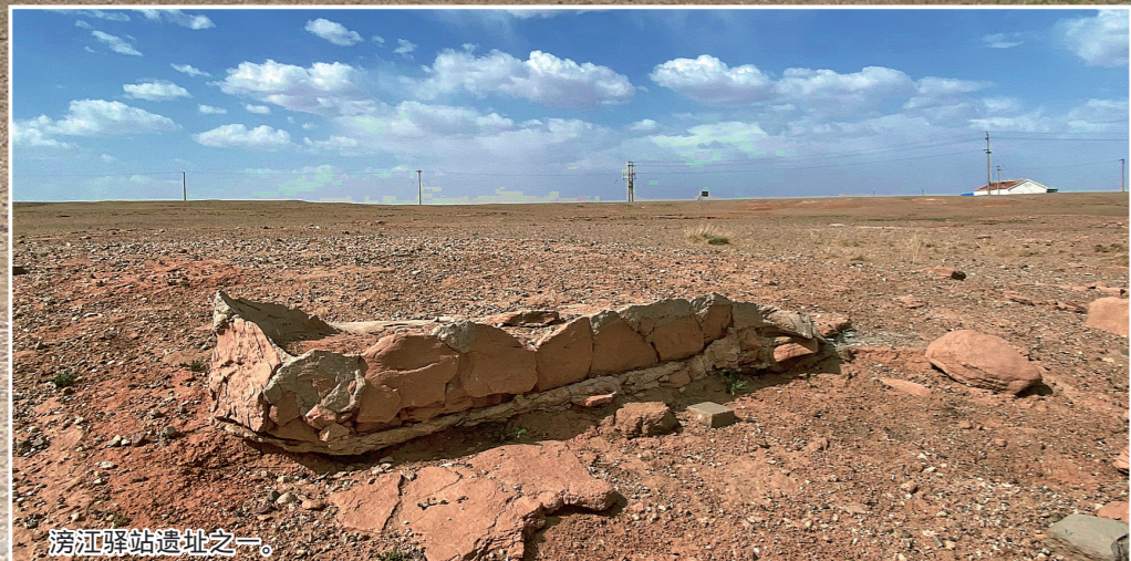
涝江驿站遗址之一。