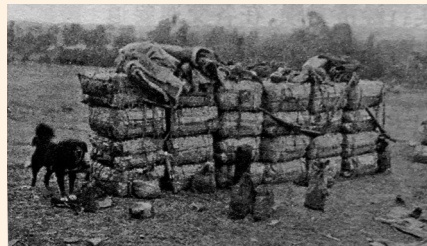
旅蒙商的货物。(资料图)