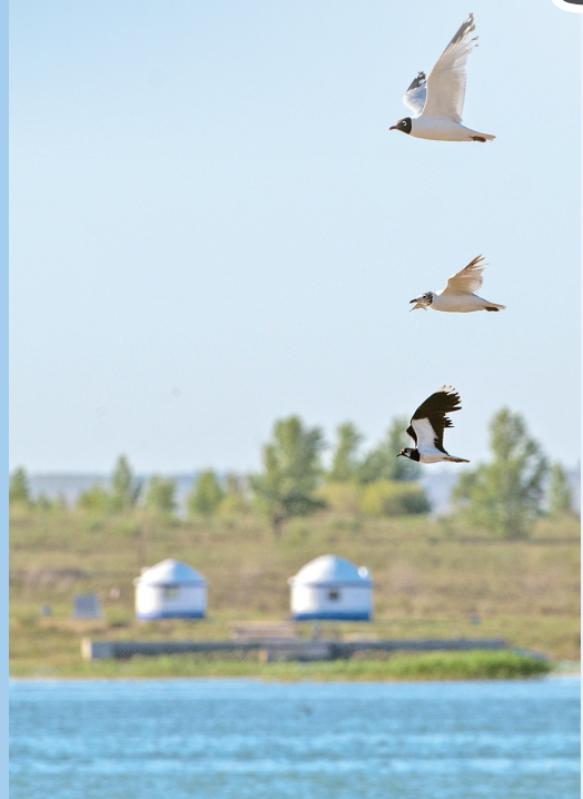
遗鸥掠过水面,与远处的蒙古包相映成趣。