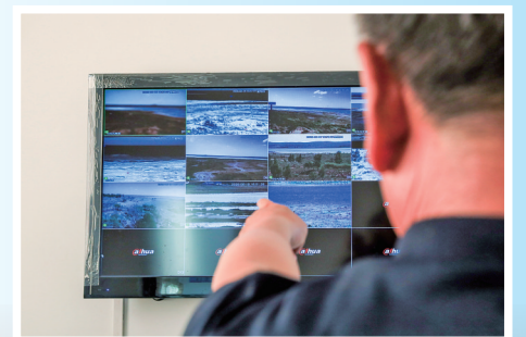
通过监控查看保护区内的情况。