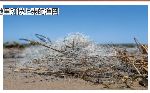
湿地里打捞上来的渔网