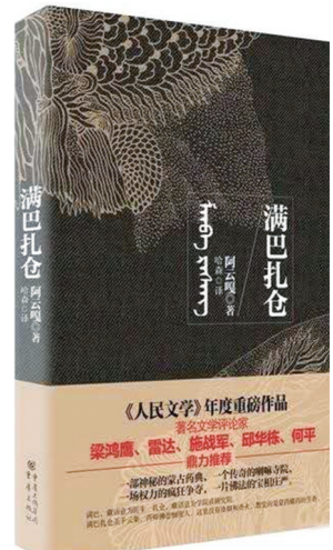
长篇小说《满巴扎仓》