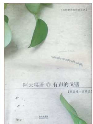
长篇小说《有声的戈壁》

阿云嘎先生的作品为大漠草原而书写,从个人的生存经验出发,表达对本民族在现代化进程中的经济转型、生态环保、民族文化精神弘扬、传承及保护、民族历史的发展变化等等的思考,个人经验故事与一个国家、一个民族进入现代化的进程联系在了一起,与国家现代化的诉求关联在了一起,深刻反映古老草原在新时期的巨大变迁。