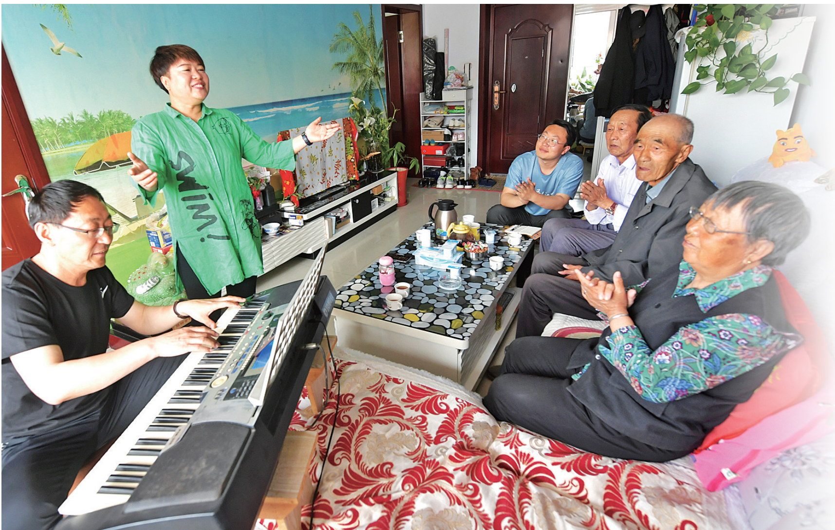
一家人都热爱文艺。