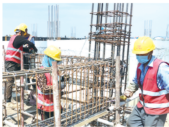
热火朝天的施工场景。