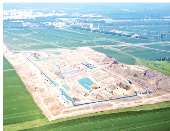
有机奶项目施工鸟瞰图。