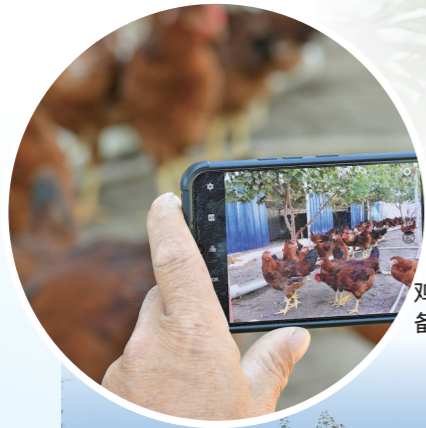
给生态鸡拍照,准备出售。

近年来,巧什营镇加快农业产业结构调整,大力发展种养结合的庭院经济,让昔日的闲置土地,变成了一个个增收园。