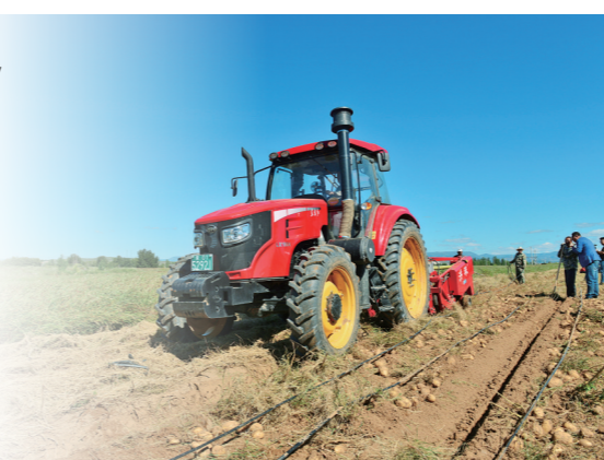
机器轰鸣声中,一颗颗新鲜饱满的土豆从沙土里冒出来。