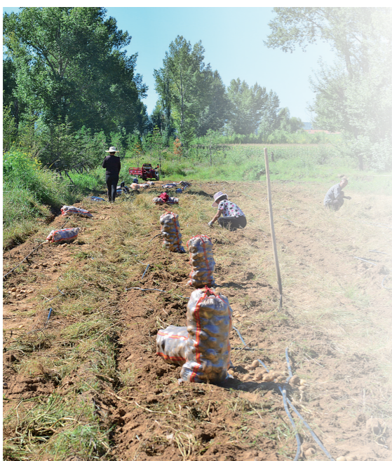
红吉讨号村马铃薯种植基地里一派繁忙景象。