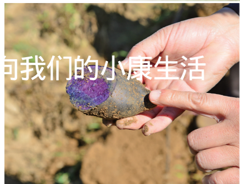
紫土豆的产量低,但是市场价格高。