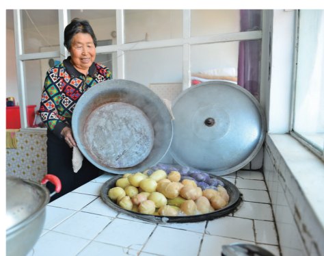
香喷喷的土豆出锅了。