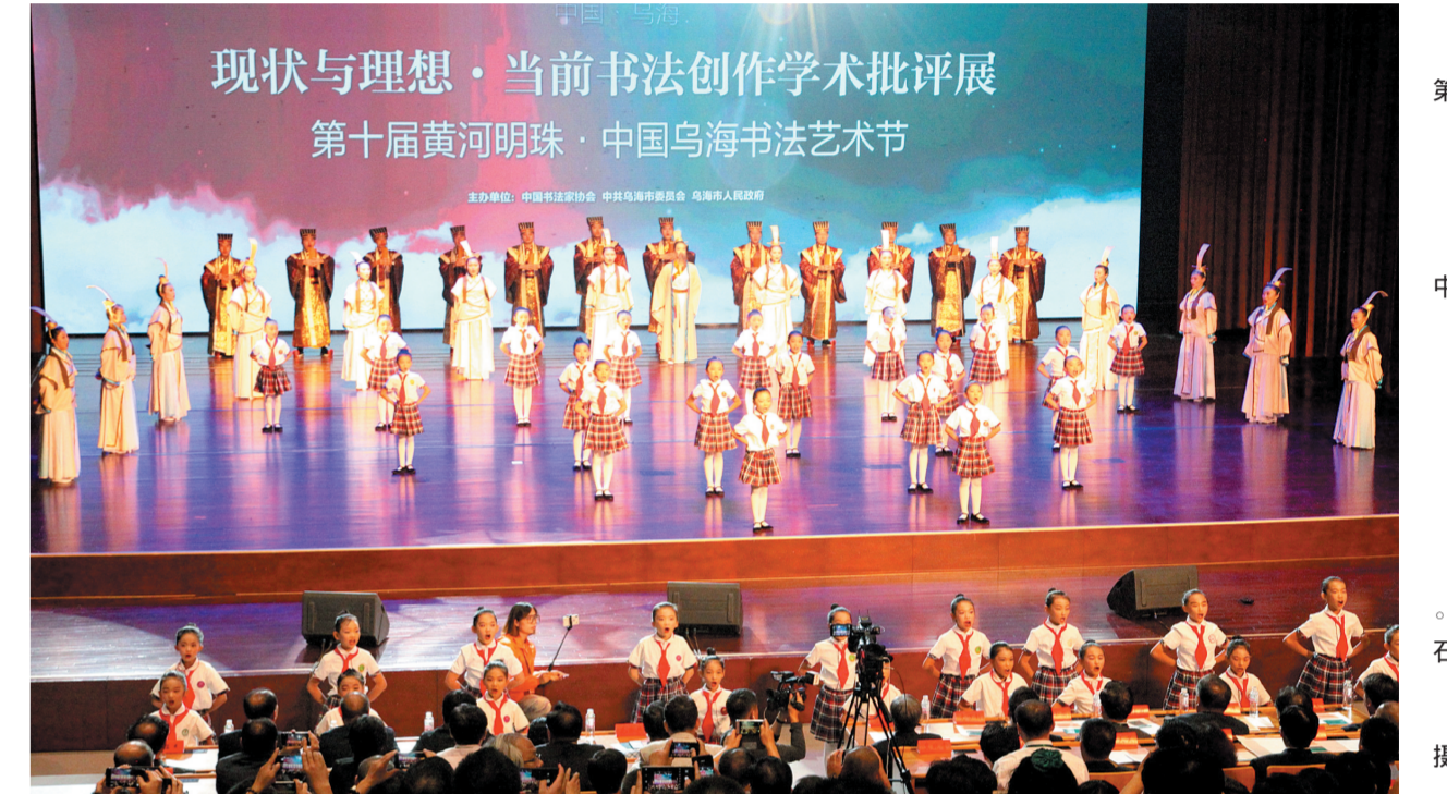
现状与理想·当前书法创作学术批评展 第十届黄河明珠·中国乌海书法艺术节