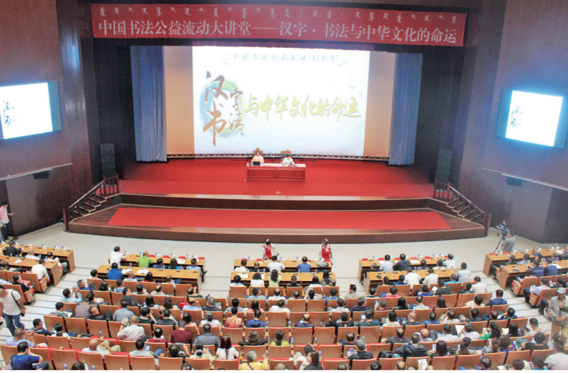
书法公益讲堂让全民共享文化大餐。