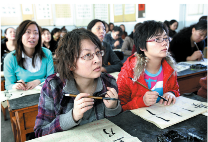
市民参加书法培训。