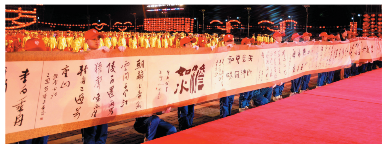
2010年,首届国际书法产业博览会暨第四届黄河明珠·中国乌海书法艺术节上,来自30多个国家和地区的100位书法家创作的百米长卷,创造了新的大世界基尼斯纪录。

如今的乌海,虽然不是人人都是书法家,但是人人喜爱书法,虽然不是人人都以书法为事业,但人人都接受着书法艺术的熏陶。