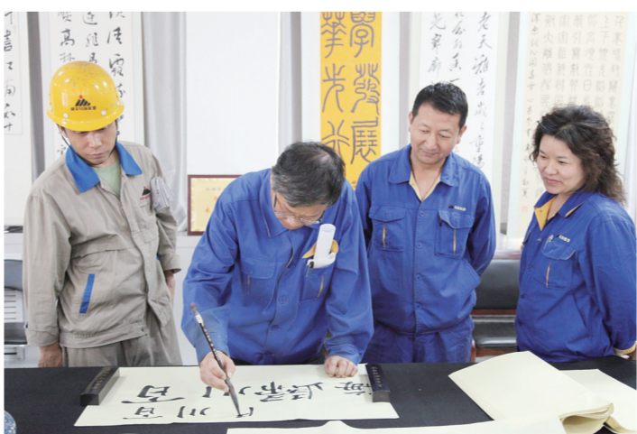
企业职工书写书法作品。