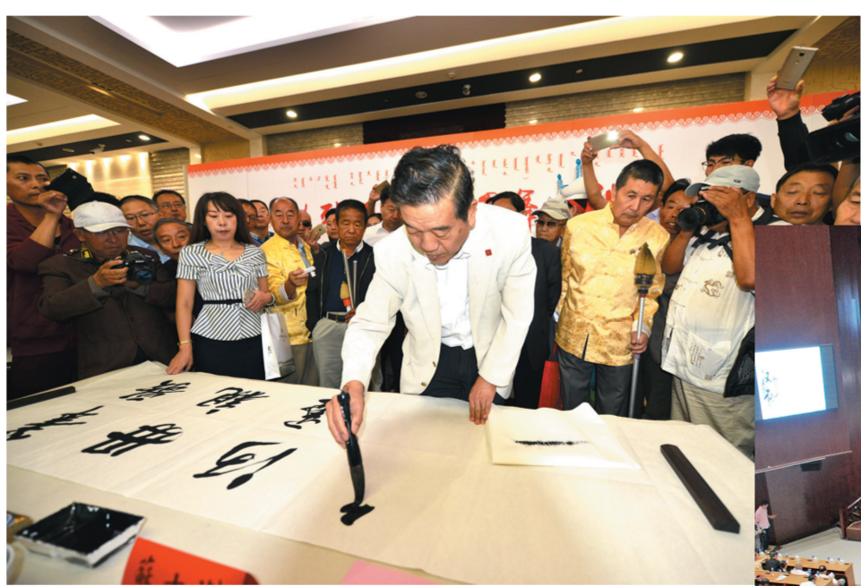
2017年中国乌海书法艺术节上,中国书法家协会主席苏士澍现场挥毫泼墨。