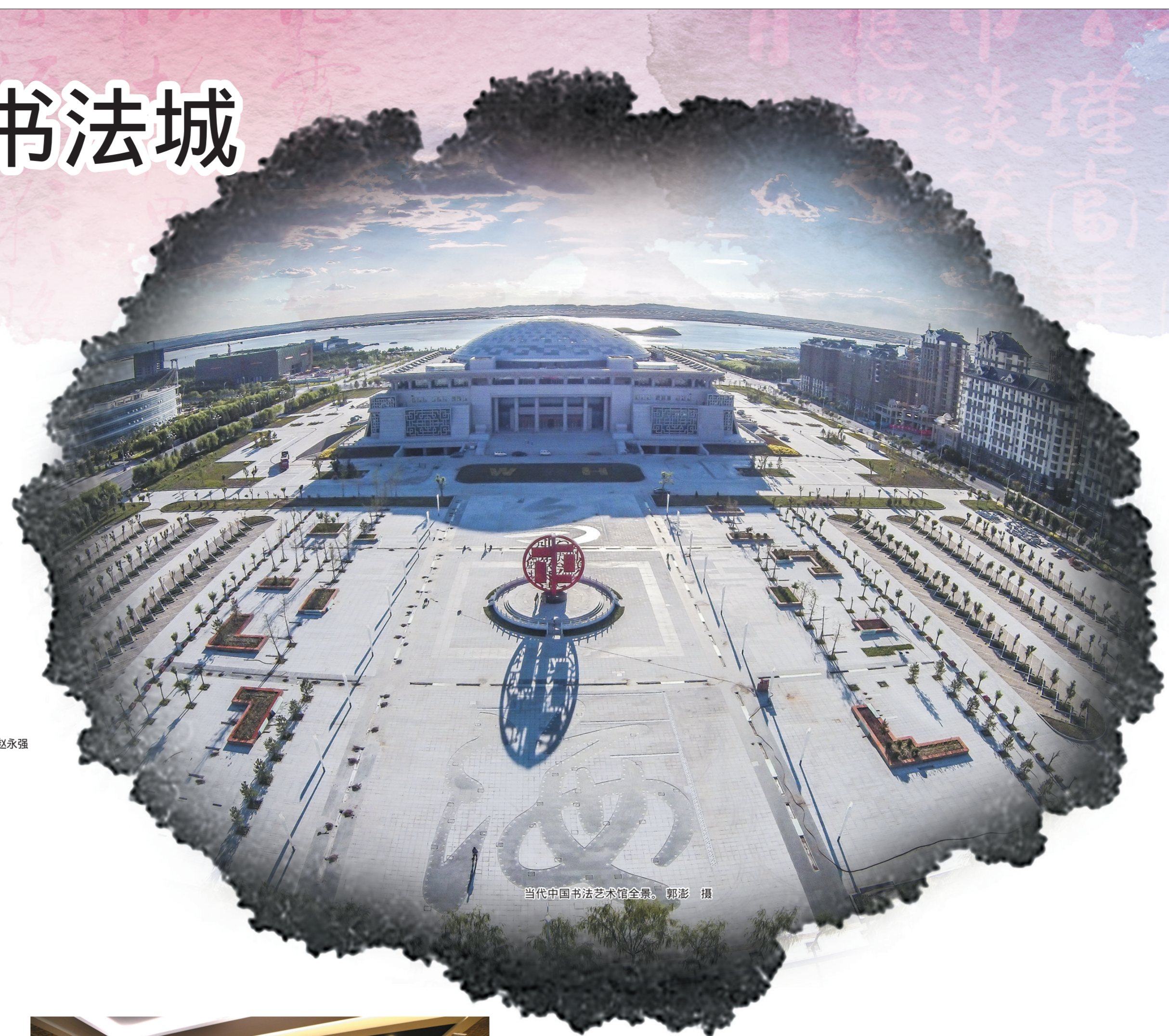
当代中国书法艺术馆藏。