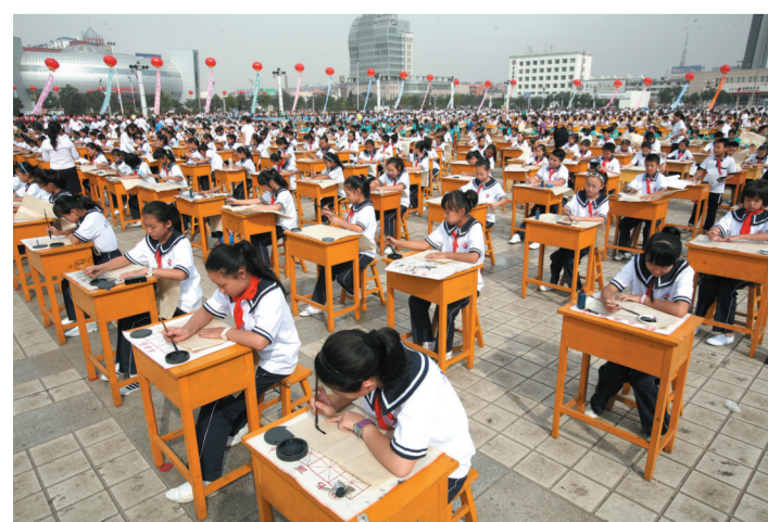
校园书法活动提升学生书法素养。

走进社区,书法爱好者挥毫泼墨展风采;走进校园,学生们一笔一画临摹字帖;走进机关,丰富多彩的书法活动经常开展;走进企业,技艺精湛的职工书法作品让人赞叹。源远流长的书法文化让这座年轻的新兴工业城市颇具儒雅之风。