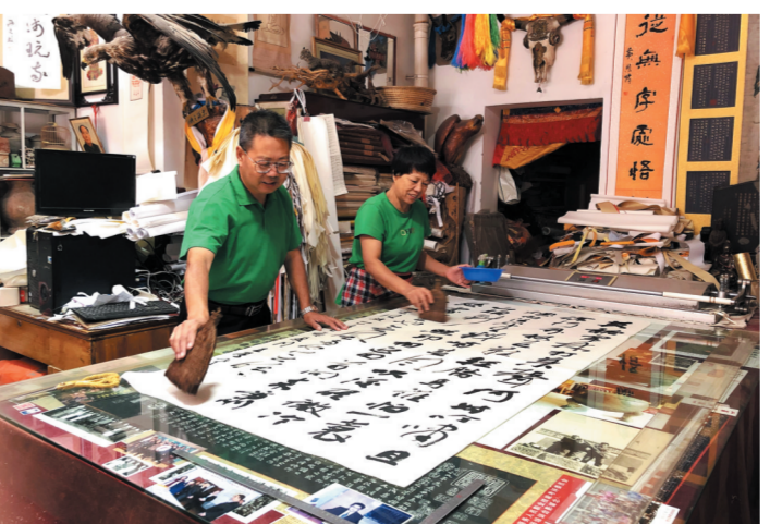
书画装裱等文化产业蓬勃发展。