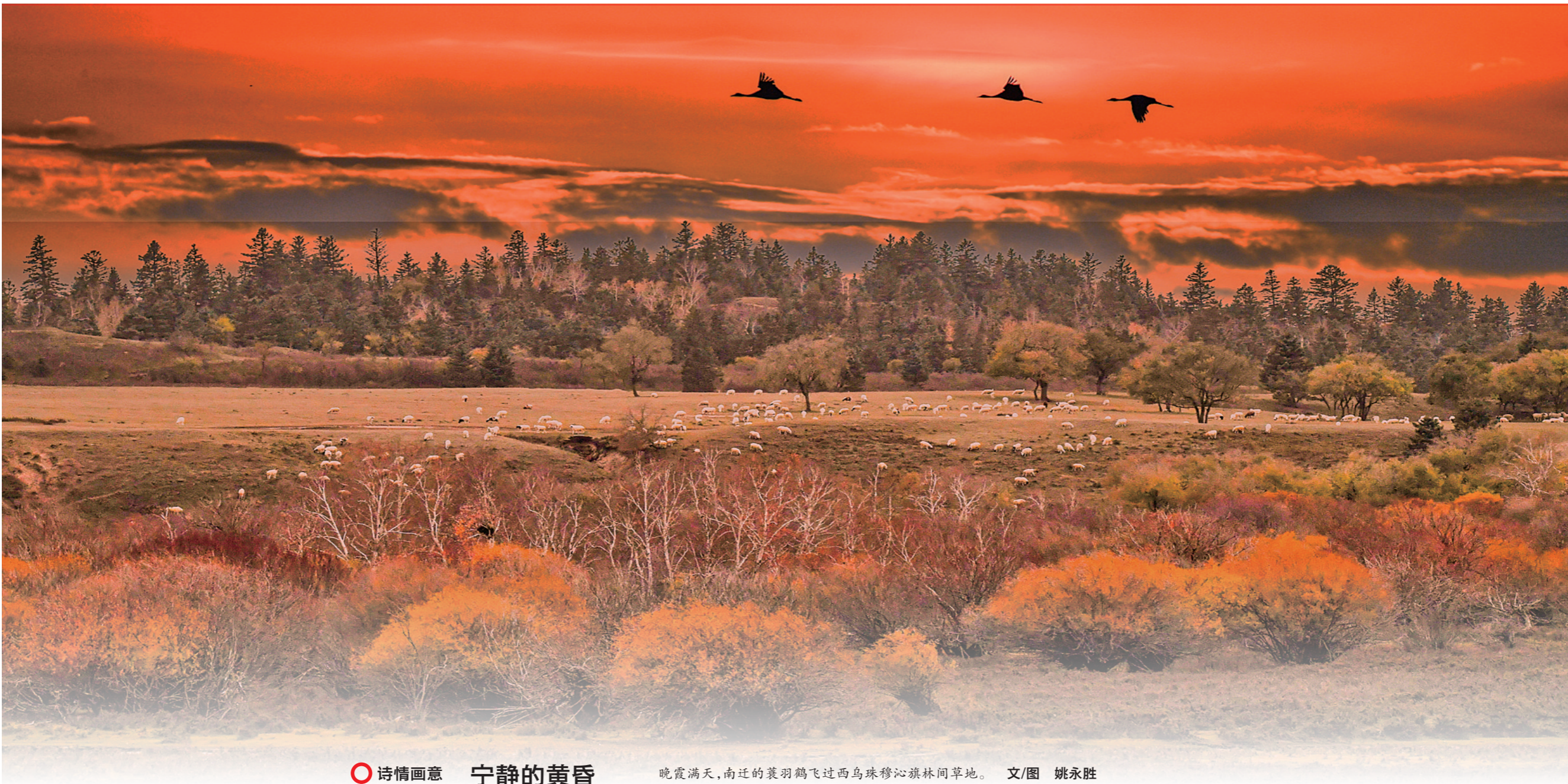
诗情画意 宁静的黄昏