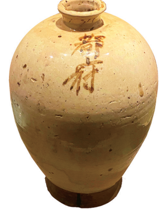
东胜州故城出土的元