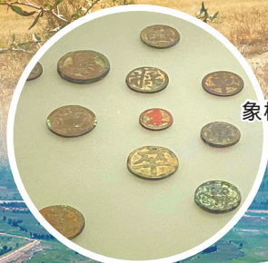
东胜州故城出土的元代铜象棋子。