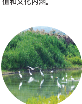
大黑河上白鸢联翩。

从古至今，大黑河上的一座座桥梁，与周围的自然山水互相映衬，融为一体，构成一道道亮丽的风景，具有珍贵的历史价值和文化内涵。