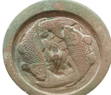
东胜州故城出土的金代双鱼铜镜