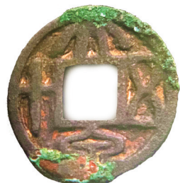
东胜州故城出土的辽代大泉五十。