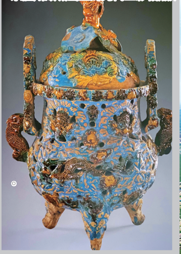
东胜州故城出土的元代三彩釉熏炉