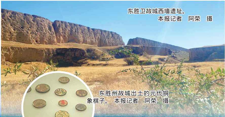
东胜卫故城西墙遗址。